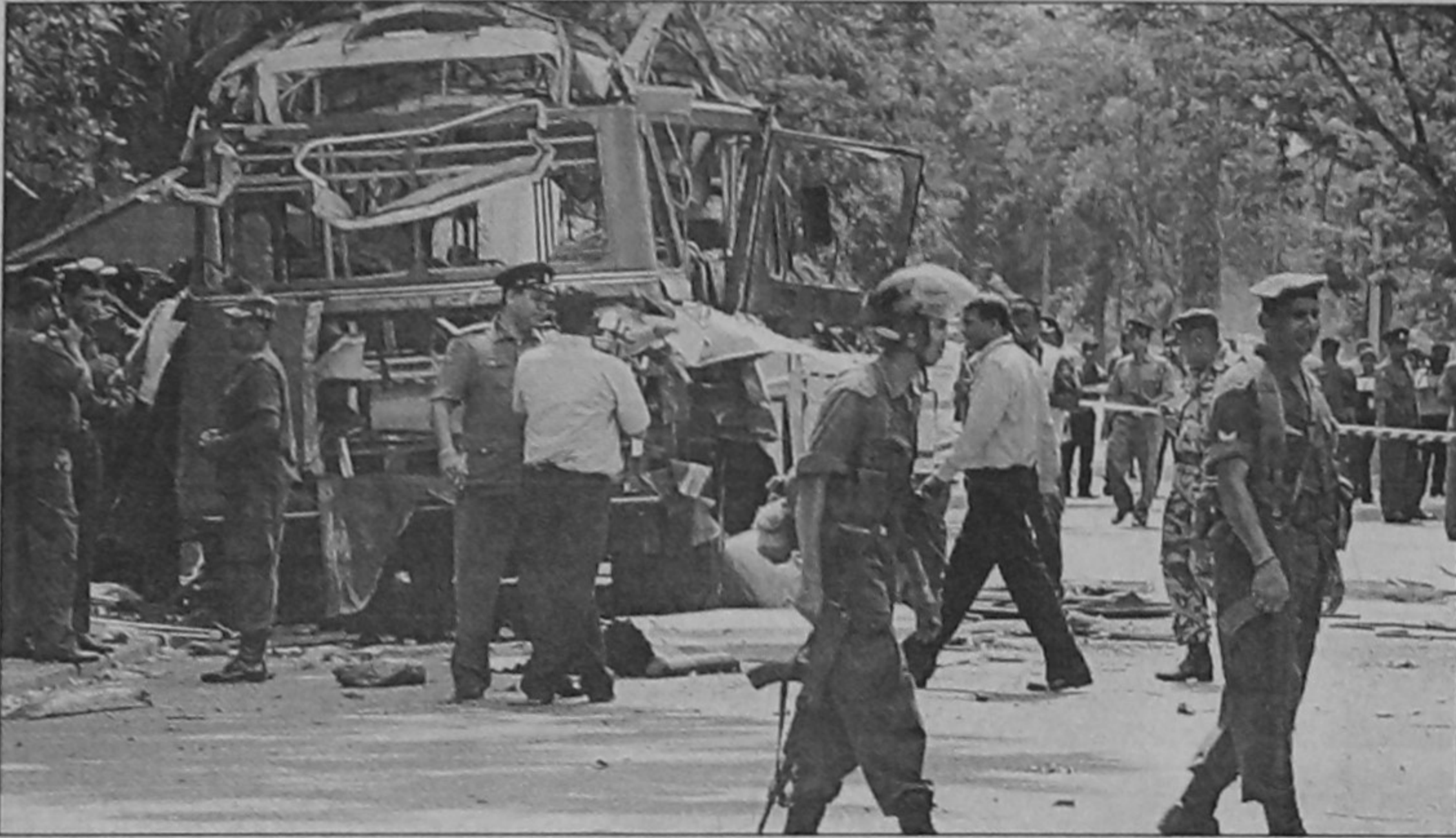
Police investigate the wreckage of a bus damaged in an explosion in Colombo yesterday. Tamil Tiger rebels set off a powerful bomb inside a public bus in the centre of the Sri Lankan capital, wounding four people, the defence ministry said.

"Militants are getting support from across the border and it is a fact," Defence Minister AK Antony told reporters in New Delhi, responding to a question about possible Pakistani involvement in the blasts. "It is a matter of serious concern."