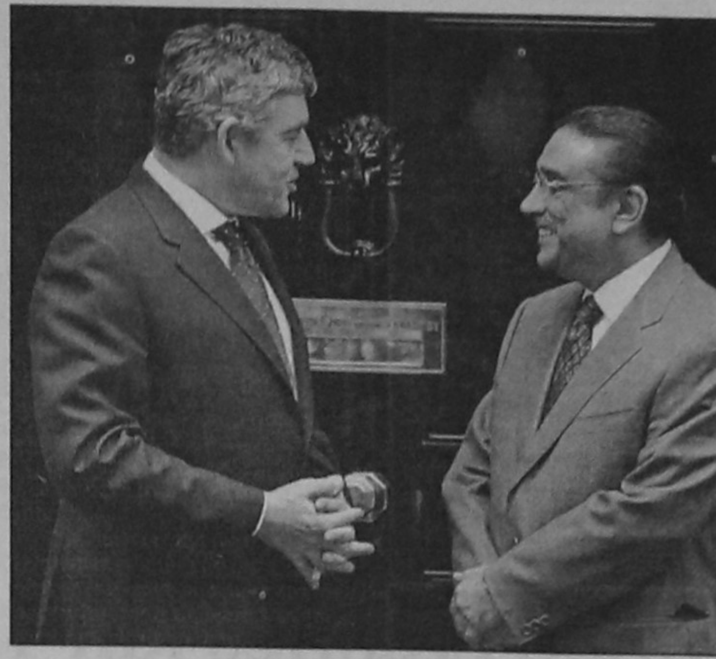
British Prime Minister Gordon Brown (L) greets Pakistan President Asif Ali Zardari on the steps of 10 Downing Street in London yesterday. Zardari held talks with British Prime Minister Gordon Brown on Tuesday on the contentious issue of militancy in tribal areas along the Afghan border.

Civilian deaths in these attacks have stirred local anger and strained the relationship between Washington and Islamabad.