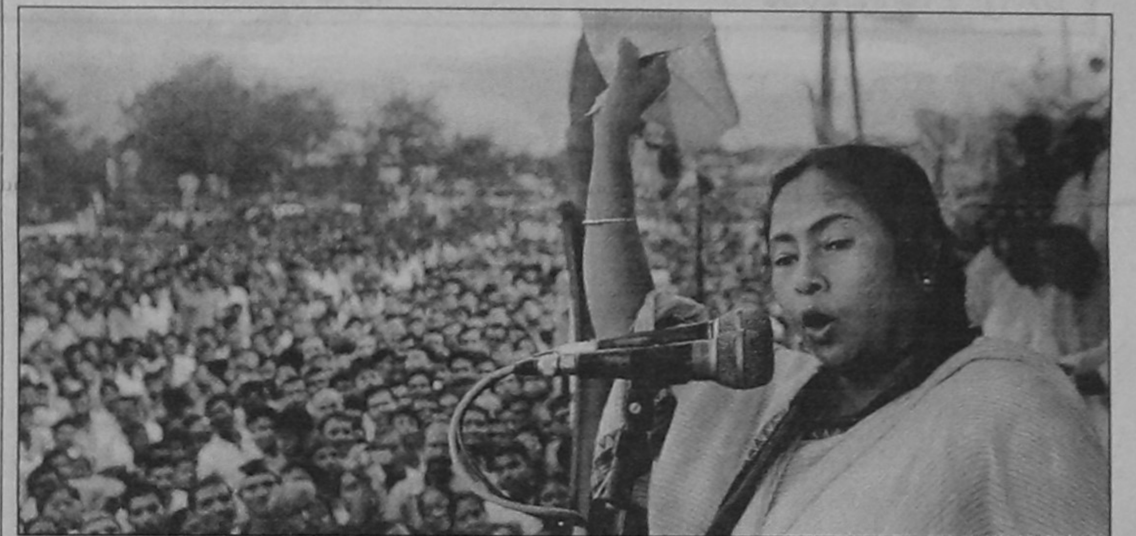
Leader of India's Trinamool Congress (TMC) party Mamata Banerjee gestures as she addresses a sit-in demonstration in front of the main entrance of the Tata small car plant at Singur, some 40km north of Kolkata yesterday opposing the economic and rehabilitation package announced by the West Bengal government.

"There is an urgent need for better coordination between Afghan and international military forces to ensure the protection of civilians and welfare of war-affected communities," Pillay said.