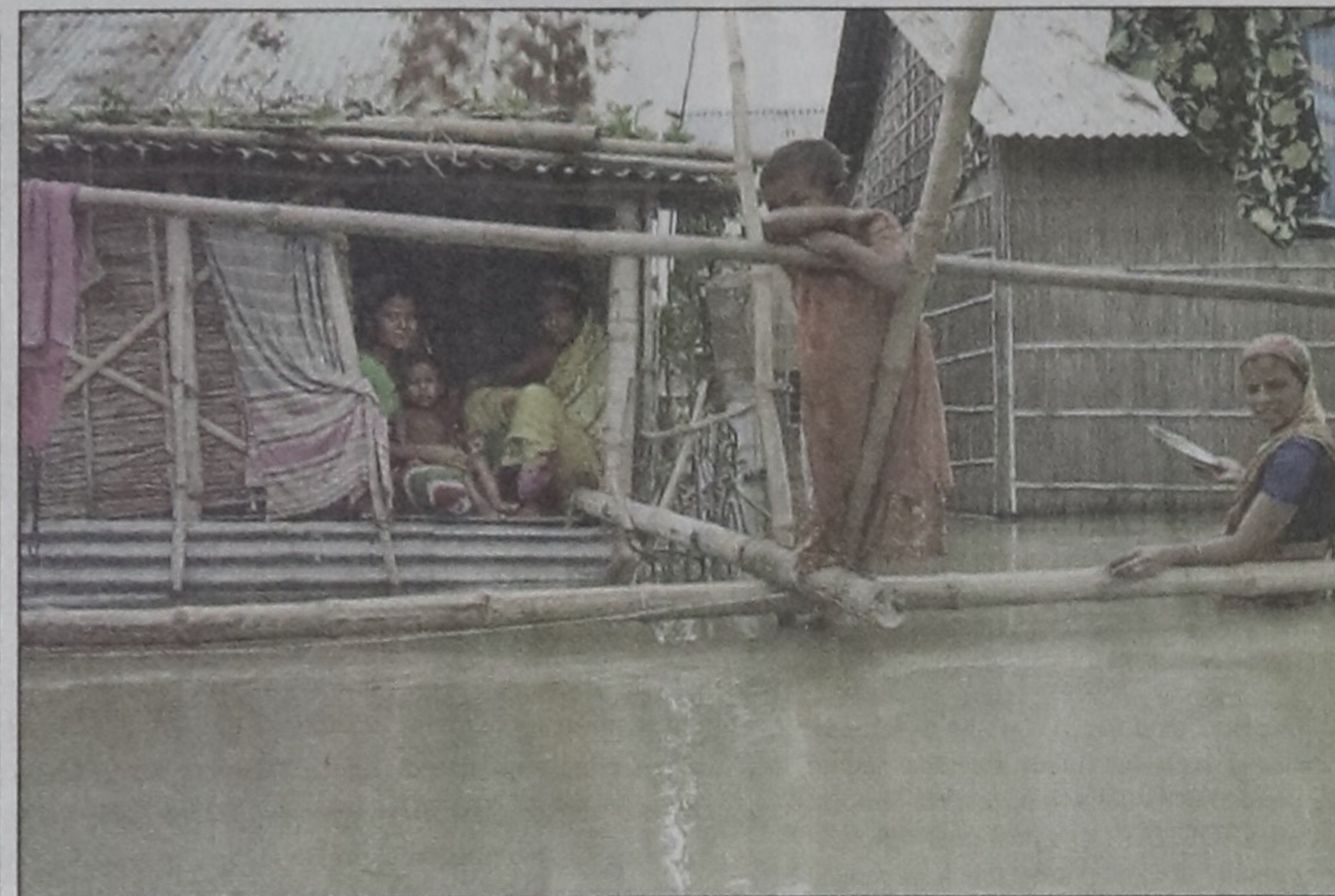
A flood victim family give a bleak look at their submerged house at Dangi village in Faridpur Sadar upazila yesterday.

The 2 NGOs placed an eight-point charter of demand before the government. They included increase of women seats in parliament through direct election.