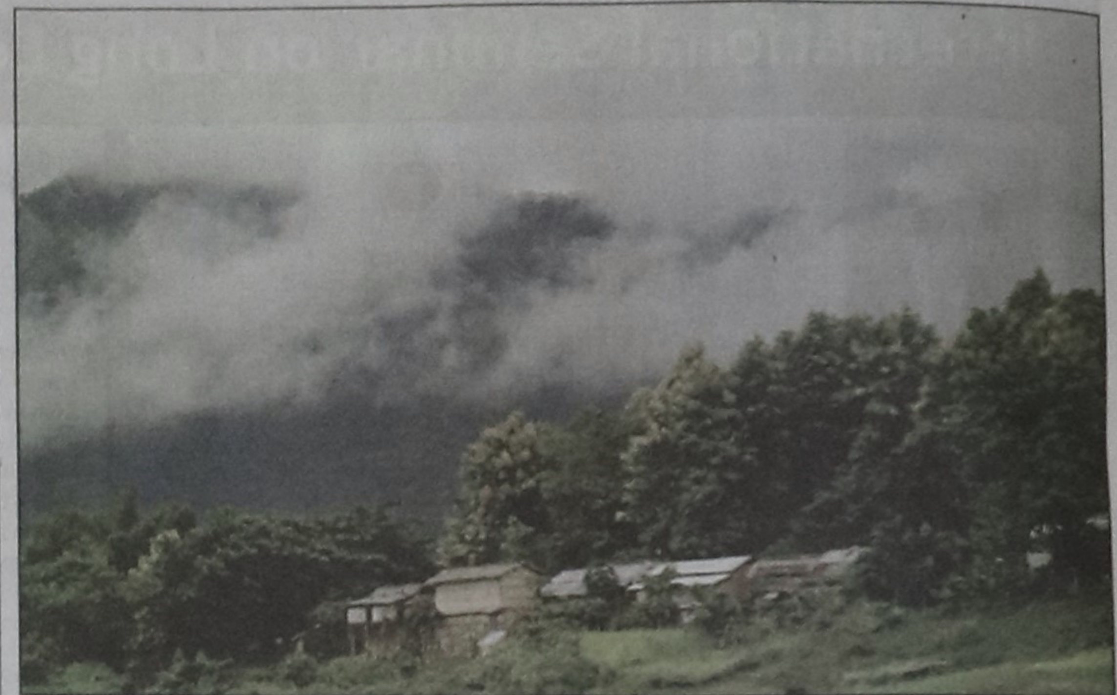
Picturesque Bandarban with its immense natural beauty appears more charming as floating clouds descent on the hills in the autumn. The photo was taken from Jibon Nagar in Thansi upazila.