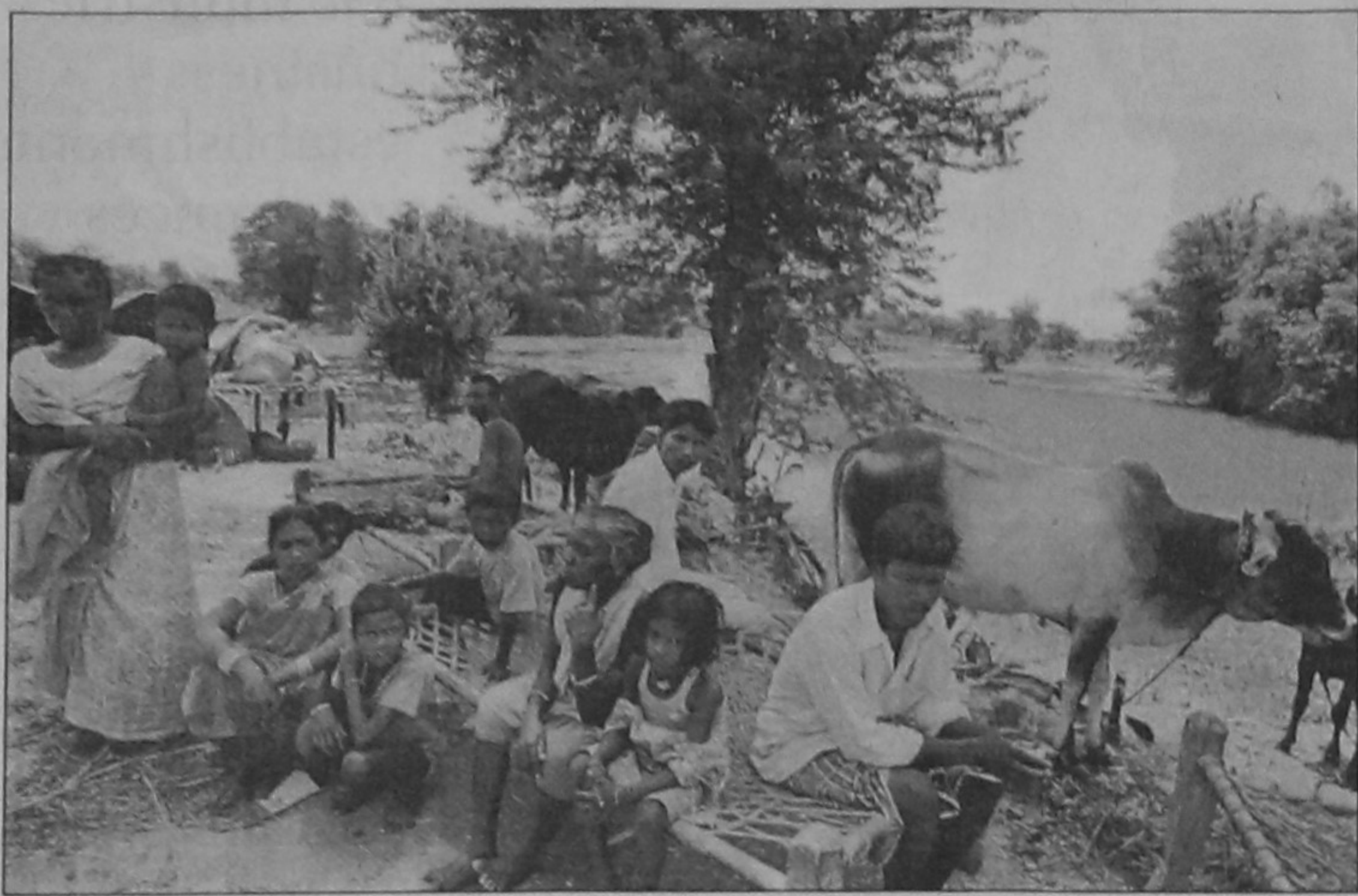
Indian flood-affected villagers wait on high ground near National Highway 107 at Jankinagar in Purnia district, some 475km north-east of Patna yesterday. Survivors of devastating floods in northeast India said the rescue operation was failing, accusing the government of abandoning those still stranded in remote villages.