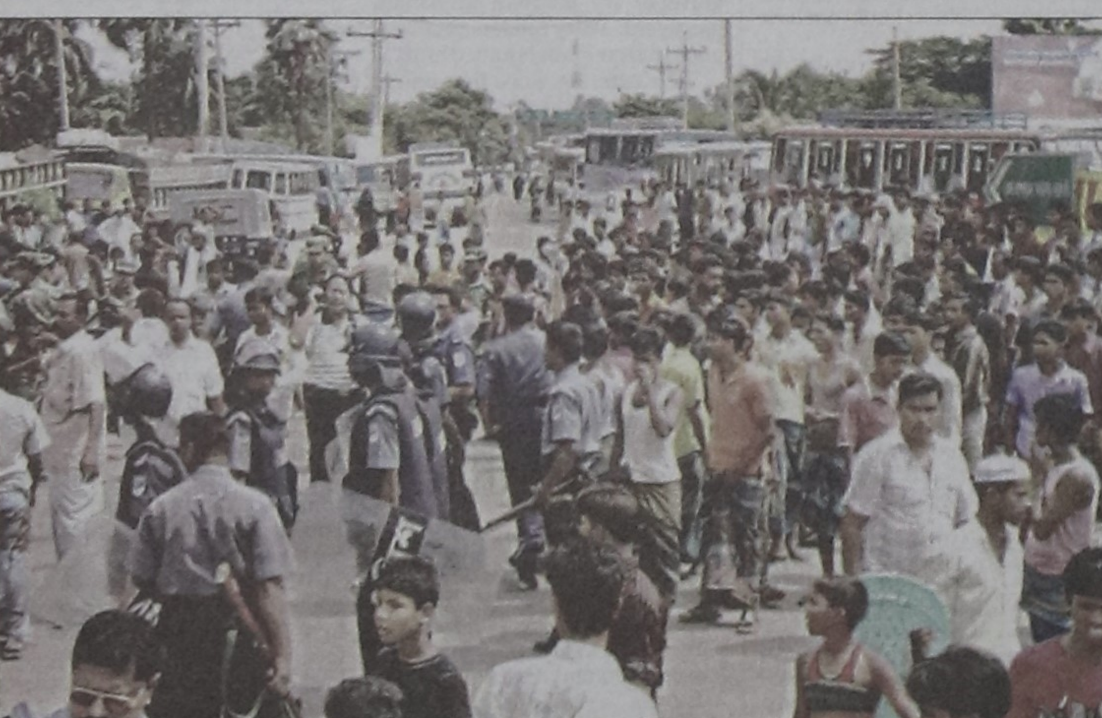
Power loom workers blockade Chouala office of Narsingdi Palli Bidyut Samity-2 and barricade Dhaka-Sylhet highway yesterday demanding uninterrupted power supply.

Traffic movement on Dhaka-Sylhet highway was disrupted for about two and half hours as jute and textile mill workers put up blockade on the highway yesterday morning protesting frequent power cut in factories. Sources said hundreds of workers took to the street at about 8:00am and put up blockade on the road protesting frequent power outage that disrupted production in their factories. The agitating workers withdrew blockade at about 10:30am after Deputy Commissioner Jillar Rahman assured them of taking necessary steps in this regard.