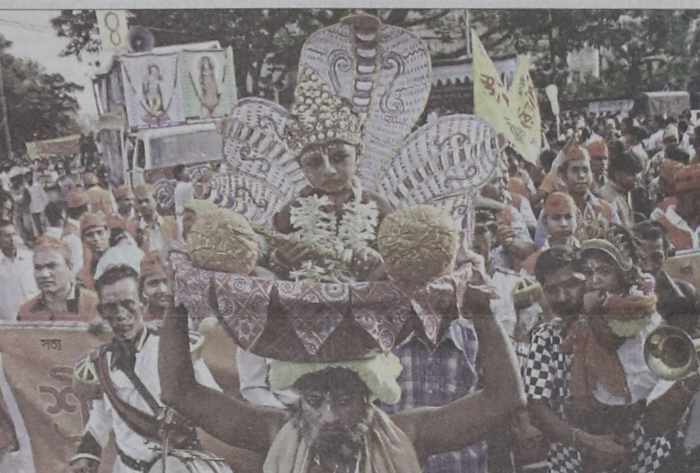
A child incarnation of Krishna being carried in a procession celebrating Janmashtami. The photo was taken at Palashi intersection in the capital yesterday.