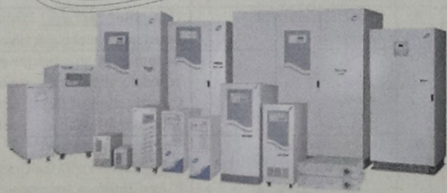
Online Industrial UPS

Announcement of Tradevision Ltd. & DB Power Electronics (P) Ltd. join hands to offer UPS and Complete Power Solutions in Bangladesh.