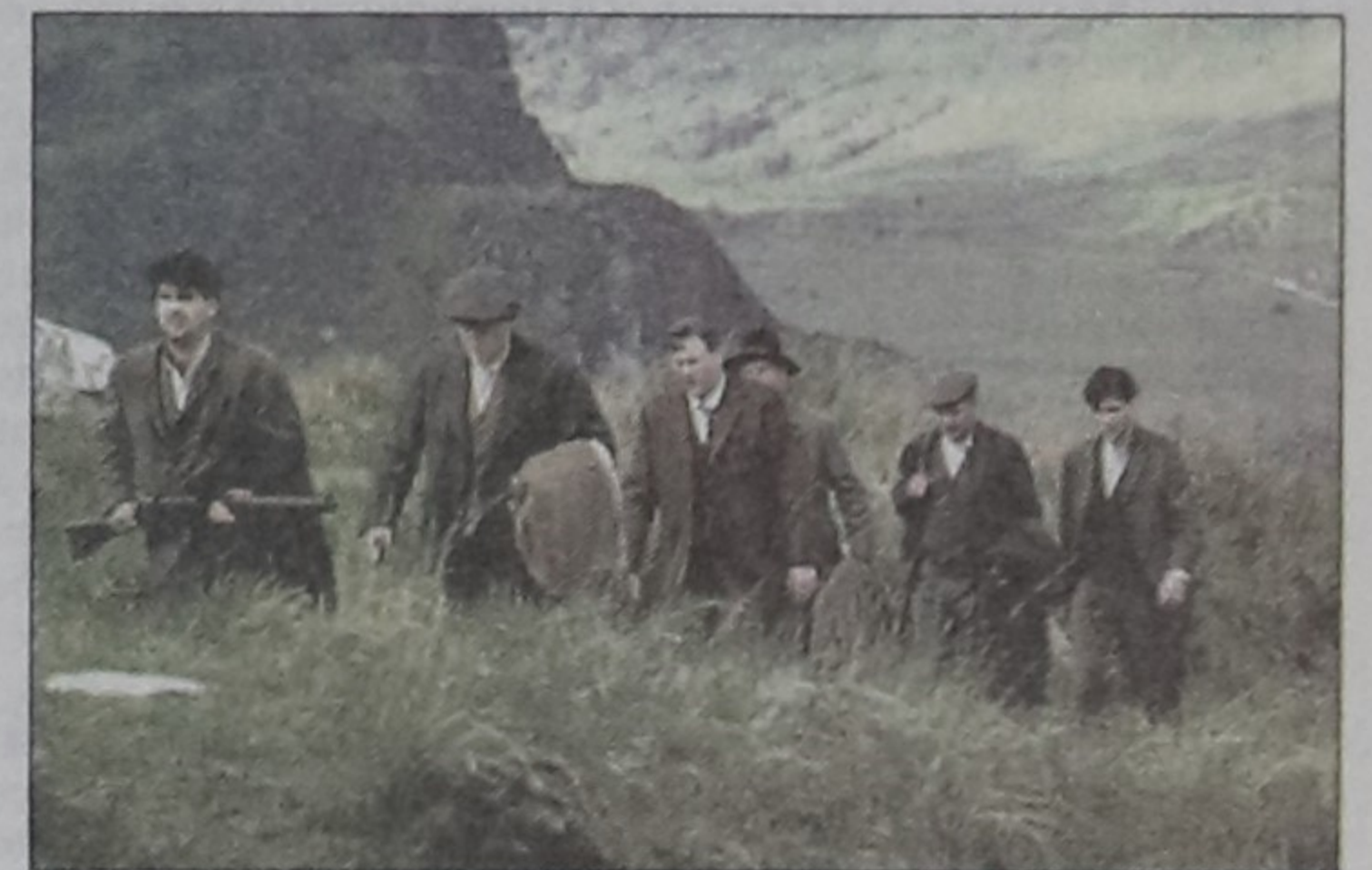
A scene from Loach's film The Wind That Shakes the Barley