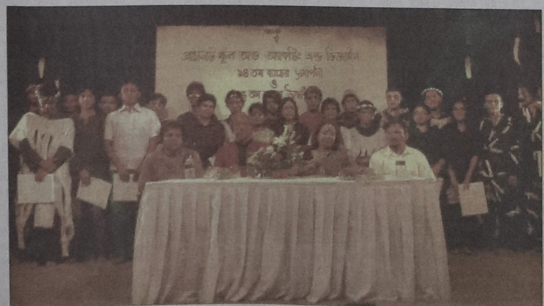
Students of Prachyanat with the guests at the certificate giving ceremony.