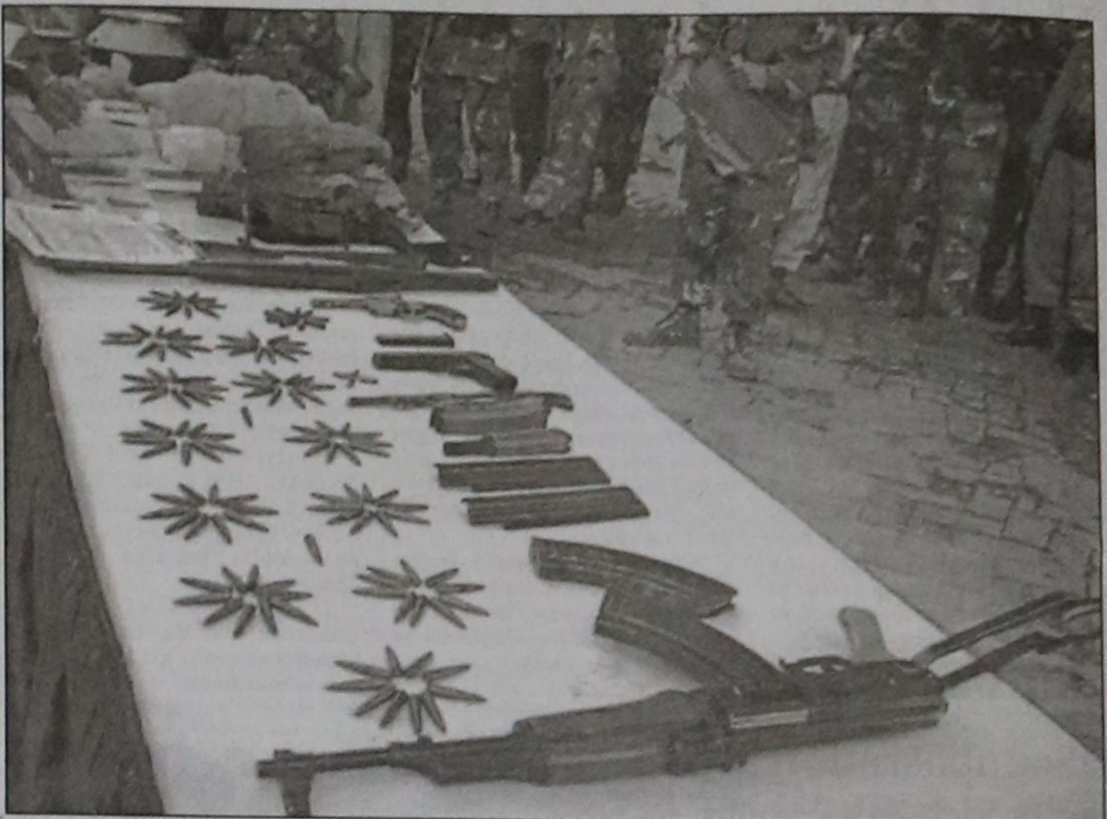
Members of Bangladesh Army recover arms and ammunition from a den of criminals at Golakparar under Mohalchhari upazila in Khagrachhari hill district yesterday. (Story on page 16)