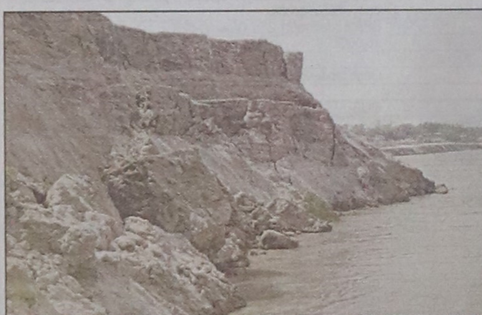
Serious erosion by Jamuna at Maizbari in Kazipur upazila in Sirajganj district, left, and shifting of a house to a safer place. The photo was taken yesterday.

Officers-in-charge and resident medical officers of all 13 police stations and upazila health complexes, advocates and journalists, spoke at the workshop.