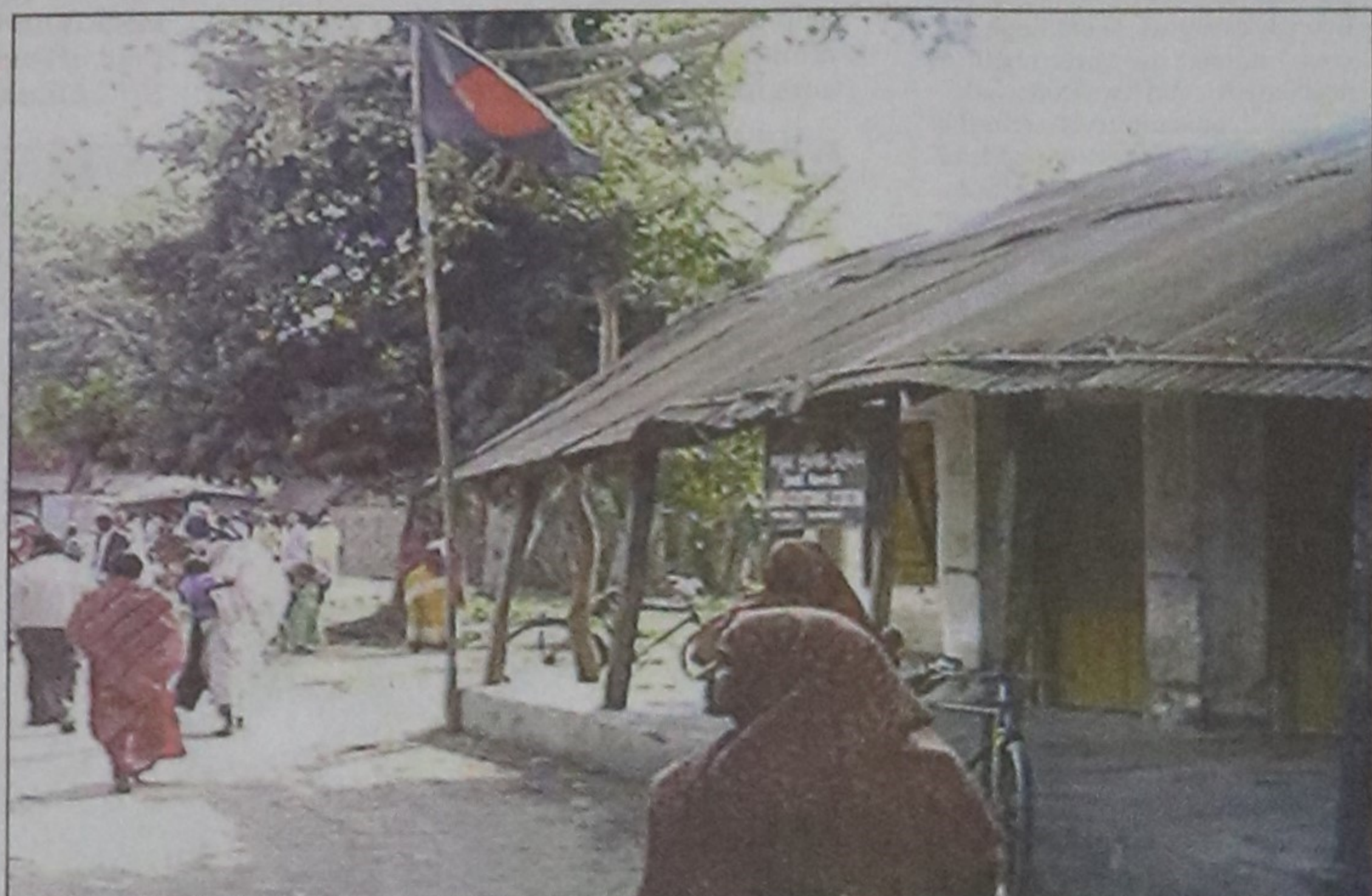
Inoperative Chilahati land customs checkpoint in Nilphamari district.