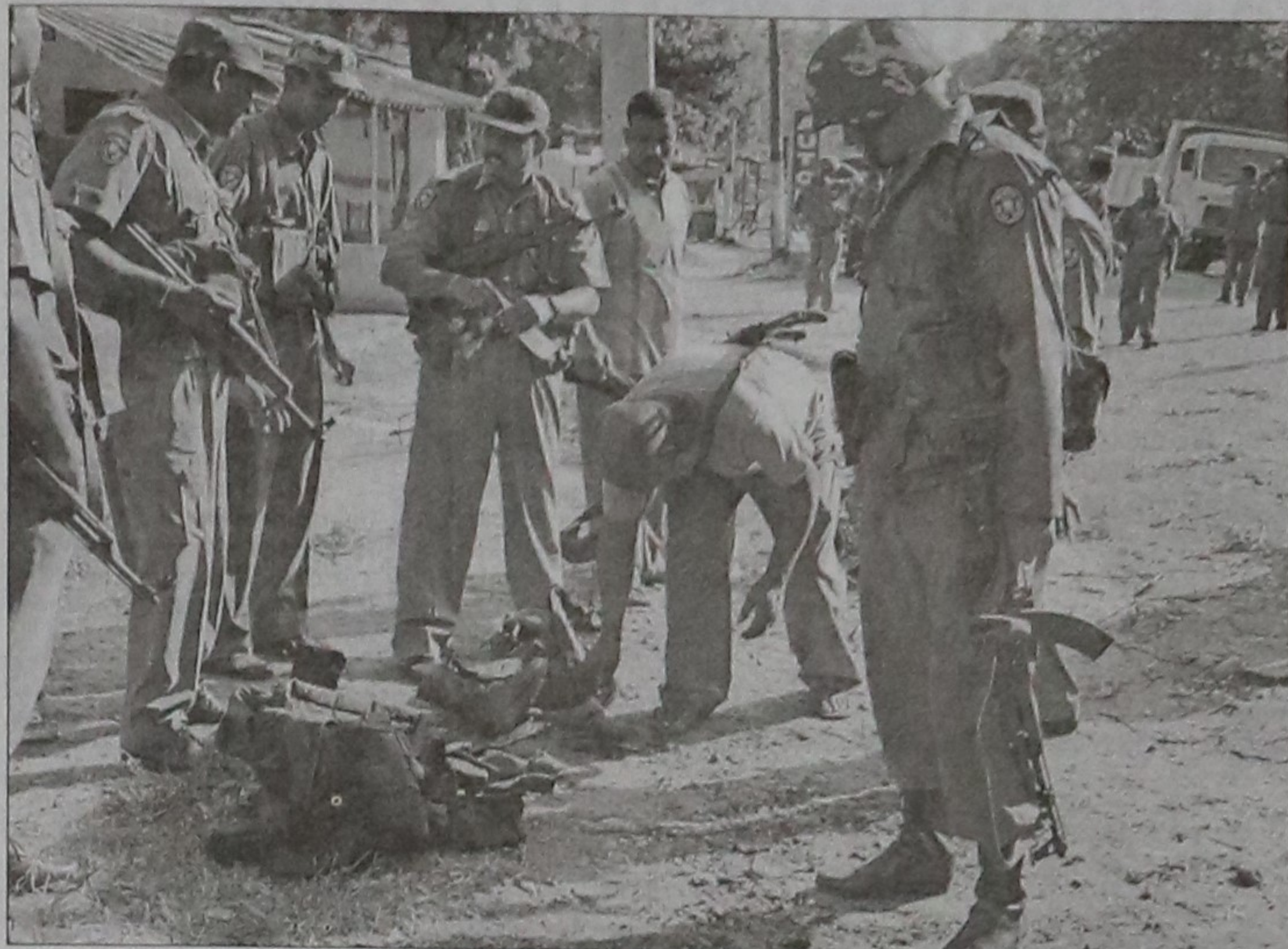
Sri Lankan policemen investigate the site of a suicide blast in the island's northern town of Vavuniya yesterday. A suspected Tamil Tiger rebel detonated explosives on his motorcycle outside a police station in northern Sri Lanka Monday, killing at least 12 officers and wounding 40 others.

A week after daring the Centre to remove Gujarat from the list of centrally-assisted states, Gujarat Chief Minister Narendra Modi has hit out at the Congress again.