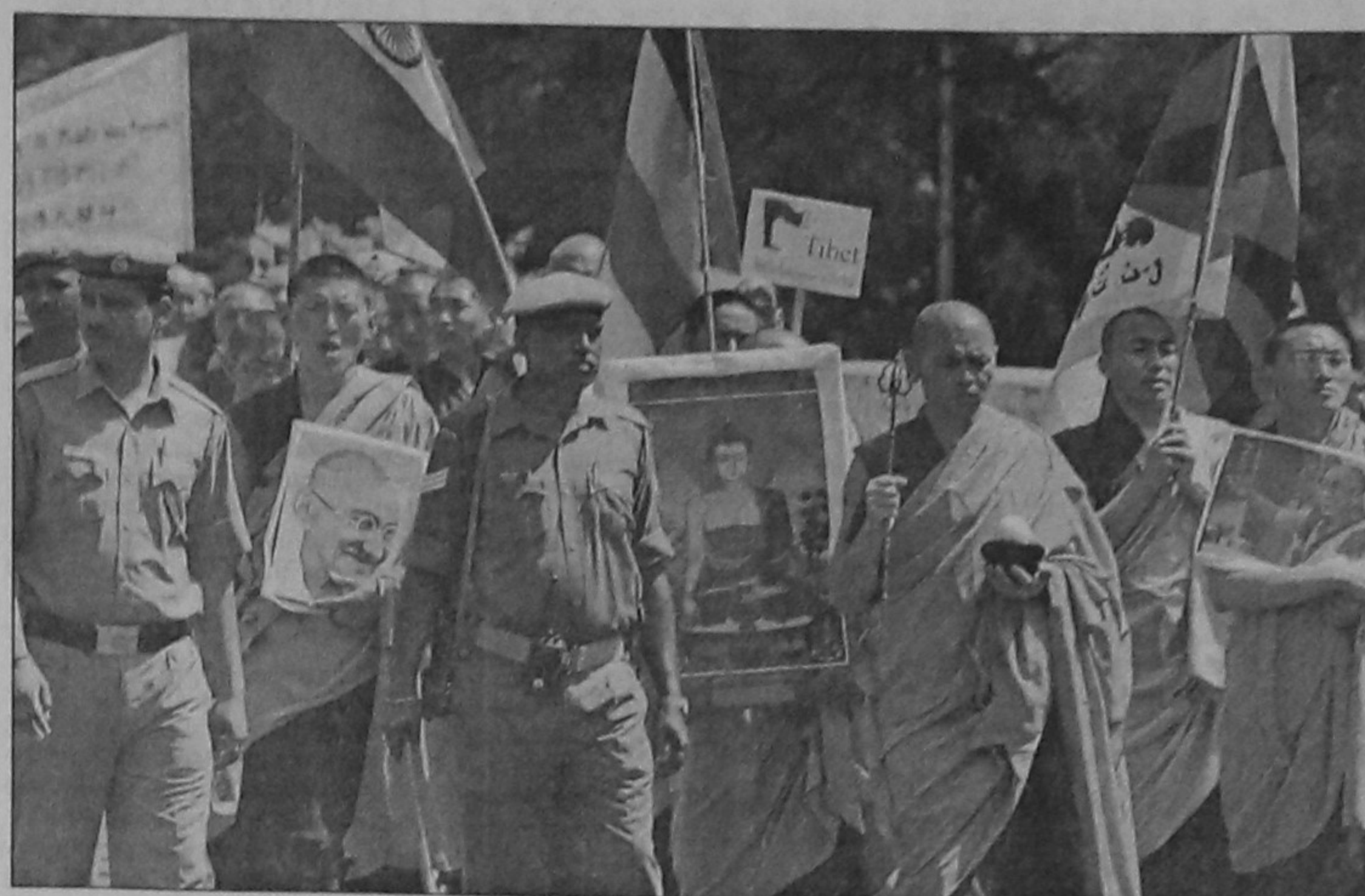
Tibetan monks in exile take part in a march in New Delhi yesterday. A group of Tibetans in exile marched against the alleged Chinese crackdown on unrest in their homeland.

In addition to these state-level groups, the agencies are keeping tabs on the activities of the Liberation Tigers of Tamil Eelam (LTTE), Tamil Nadu Liberation Army, Tamil National Retrieval Troops, Students Islamic Movement of India (SIMI - banned since September 2001), Deendar Anjuman, Asif Reza Commando Force, Kamatapur Liberation Organisation and the Ranvir Sena.