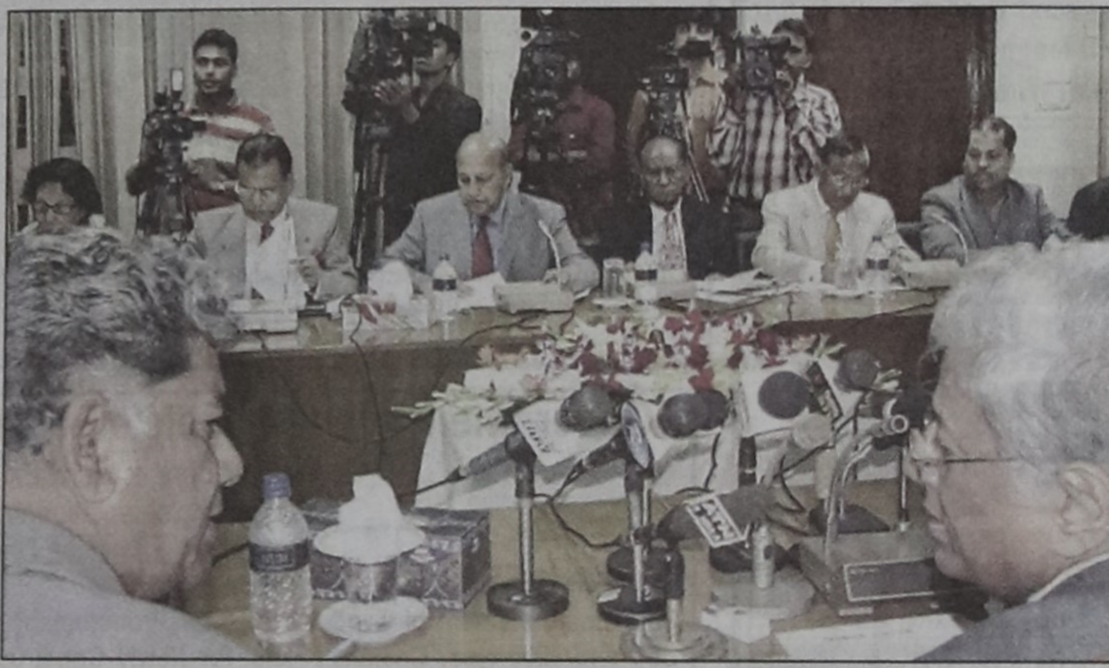
Election Commission holds a discussion with a delegation of Bikalpa Dhara Bangladesh on the first day of the second round of electoral reform talks with parliamentary political parties in the EC Secretariat conference room yesterday. (Story on Page 1)