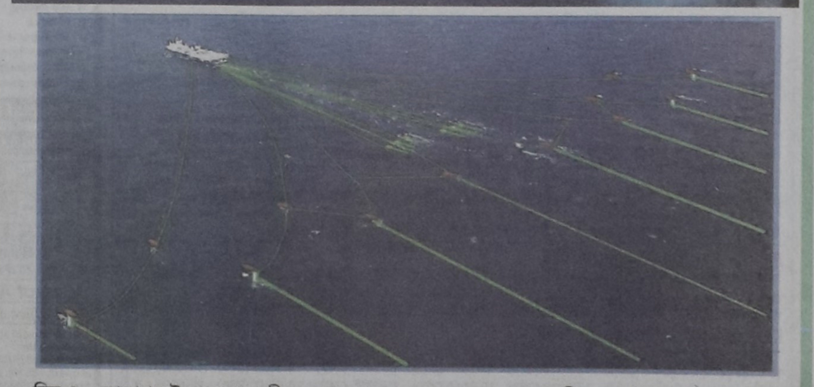
চিত্র ৪ - আকাশ হইতে দেখা জরীপ জাহাজ ও তাহার পশ্চাতের অনুসন্ধানী যন্ত্রপাতির সারির রেখাচিত্র