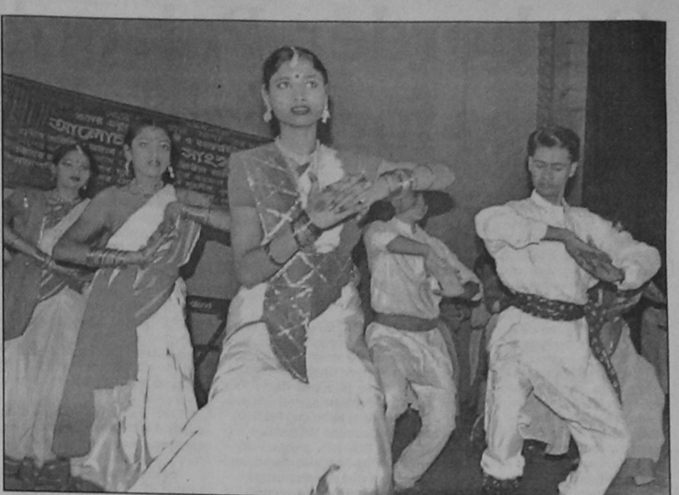
Artists performing at Rajshahi Shilpakala Academy yesterday on the occasion of Language Martyrs Day and International Mother Language Day.

They alleged that their community members are also being deprived of right to jobs. They cited the examples of recruitment in different government and non-government offices including the civil surgeon's (CS) office where only one out of 10 posts was appointed from sweepers.