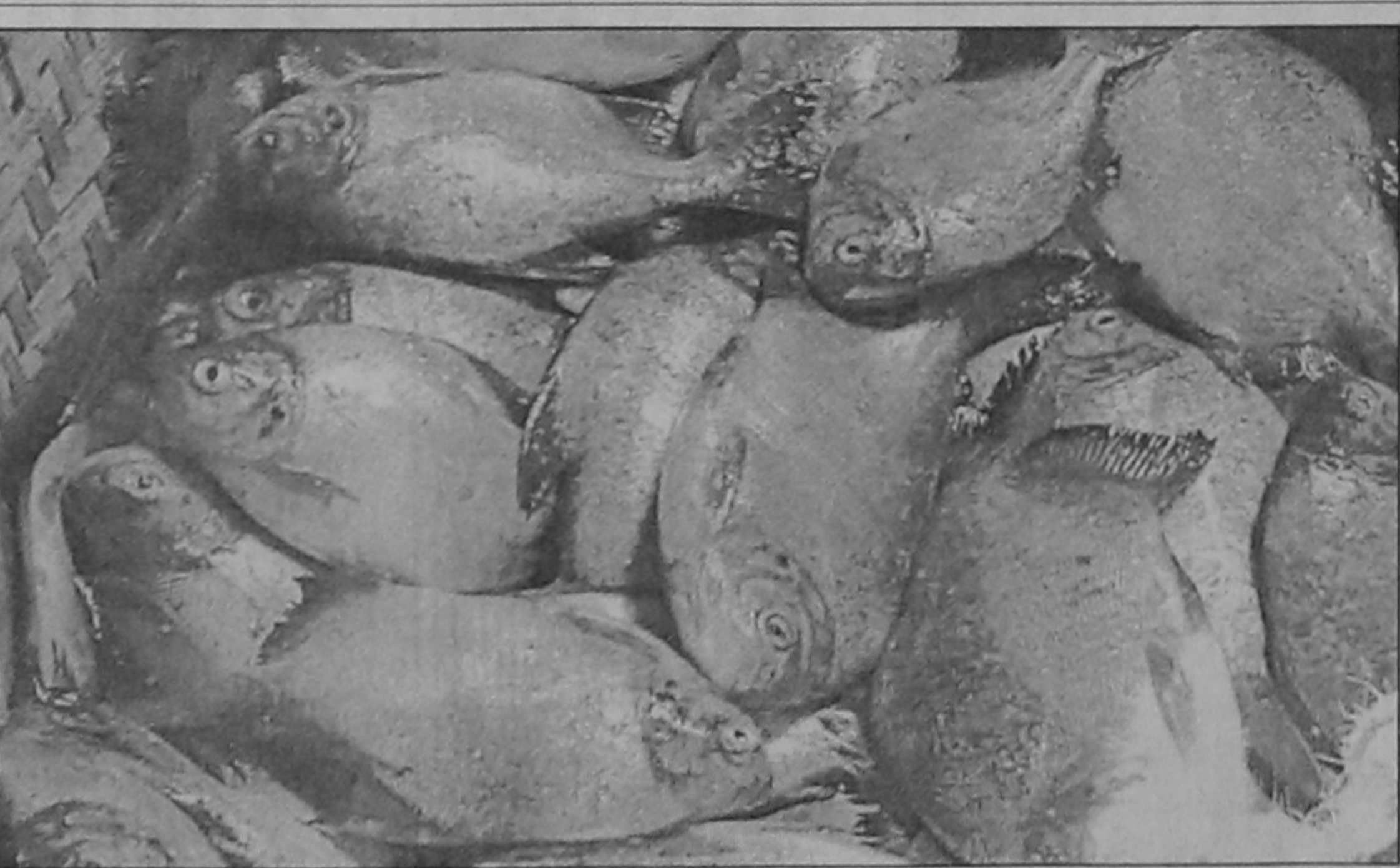
Cultivation of Piranha, a threat to other fishes as well as humans, is banned but a large quantity of the fish was brought at Fisheryghat market in Chittagong on Thursday.