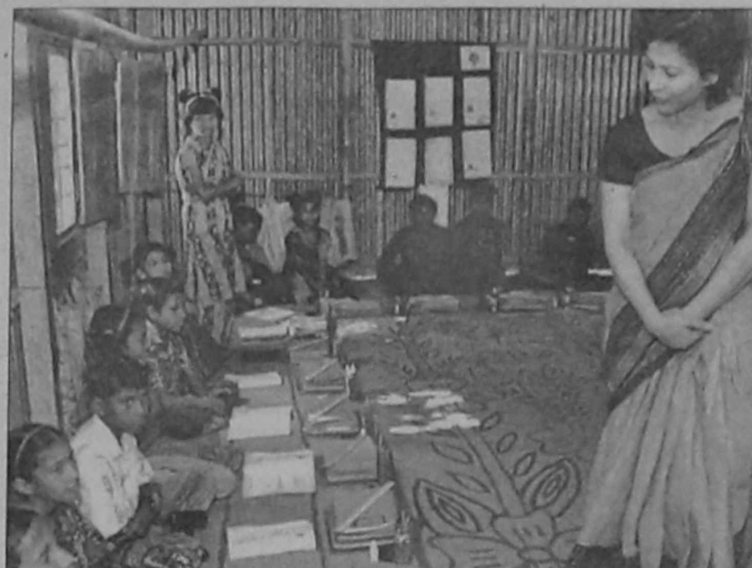
Amnesty International Secretary General Irene Khan visits a Brac school at Isapur in Tangail during her recent trip to Bangladesh. She also visited several programmes of Brac such as micro-finance group meetings, anti-natal care, and human rights and education classes.

কর্মী নিয়োগে ব্র্যাক নারী, প্রতিবন্ধী ও আদিবাসী প্রার্থীদের অগ্রাধিকার দিয়ে থাকে