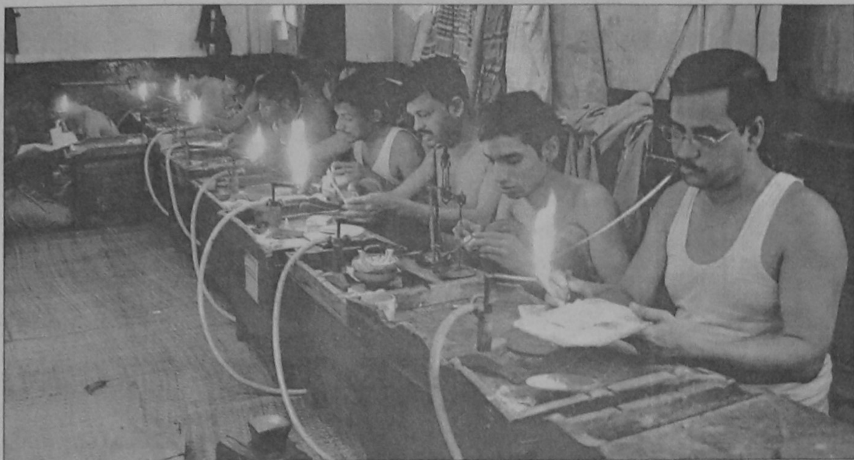
HARD DAYS AHEAD: Goldsmiths at work at Taantibazar. Due to the spiralling price of gold they are getting fewer orders than before and fear that soon they will be out of work. The artisans are losing their niche in the market these days as the machines are doing the intricate designs of gold ornaments.