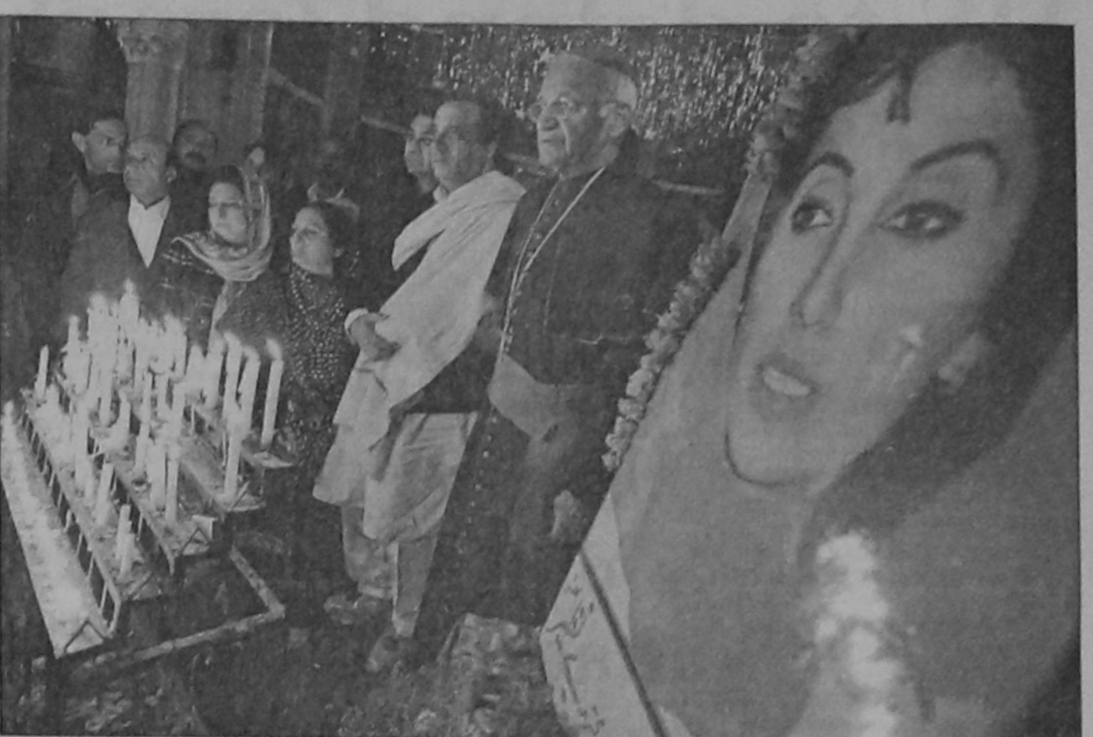
Pakistani Christians and Pakistan People's Party (PPP) leaders stand in respect during a memorial service for slain former premier Benazir Bhutto at the Sacred Heart Cathedral in Lahore yesterday. The party of murdered Pakistani opposition leader Benazir Bhutto said that President Pervez Musharraf's admission that she may have been killed by a gunman underscored the need for a UN probe.

AFP, Seoul North Korea yesterday stepped up anti-US propaganda with a six-nation nuclear disarmament process bogged down and Pyongyang and Washington in dispute over the delay. Rodong Simmun, the North's ruling communist party-published newspaper, which serves as an official mouthpiece, lashed out at what it called Washington's "strong-arm policy in international affairs." "It is an anachronistic dream for the US to try to bring to its knees and dominate other countries through high-handed practices," Rodong said. "Looking back on history, all those who tried to conquer other countries through high-handed practices met a miserable end without exception." The anti-US rhetoric came with a landmark nuclear disarmament process in North Korea at a stalemate after several months of smooth progress and after relations between Washington and Pyongyang had earlier appeared to be improving. Under the disarmament deal, the North should have by December 31 disabled its key nuclear facilities and given a full declaration of its nuclear programmes in return for aid from China, Japan, South Korea, Russia and the US.