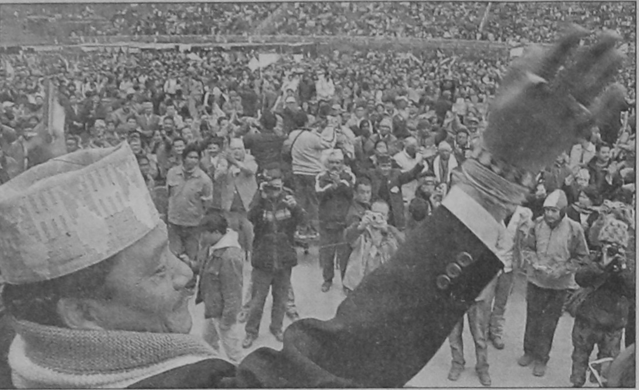
President of Gorkha Janmukti Morcha (GJM) Bimal Gurung waves to his supporters during a rally at the Leborg Gorkha Stadium, in Darjeeling yesterday. Some 50,000 GJM supporters gathered at the rally in the north-eastern Indian city, voicing their demands for a separate state called "Gorkhaland".

AFP, London Britain is planning a "diplomatic surge" in the Middle East and South Asia to help counter extremism and nuclear proliferation, Foreign Secretary David Miliband said in an article published yesterday. Writing in the Sunday Times, Miliband said 2008 would "show in word and deed" what Prime Minister Gordon Brown meant when he described his government's approach to world affairs as one of "hard-headed internationalism". "We plan a diplomatic surge in the Middle East and South Asia by raising the number of staff by 30 percent," he said. "That means we can deepen our engagement with Pakistan to prevent the growth of extremism there, including by spending an extra 80 million pounds (107 million euros, 158 million dollars) on counter-radicalisation." Miliband said the Foreign Office would prioritise work on conflict prevention, with greater co-ordination between international development officials and the military, particularly in places like Afghanistan and Iraq. Britain would also up its work in areas like combating climate change and seek to increase the effectiveness of international institutions like the European Union and the United Nations, he added. The Foreign Office played down suggestions in the Sunday Times that the increase in staff in the Middle East and South Asia would mean cutting diplomatic posts in European embassies in Paris, Rome and Berlin by one-third.