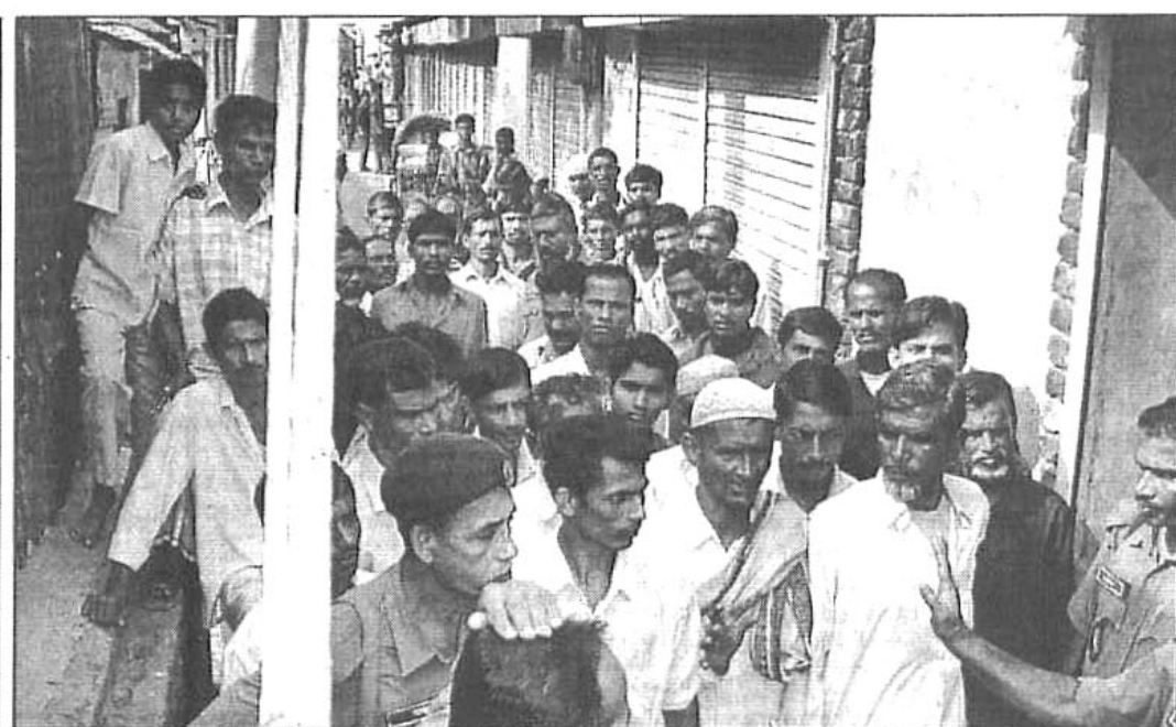
Farmers from faraway areas thronged dealers' shops at Chandpur town yesterday but were bewildered finding those locked.

Police and eye-witnesses said a country boat loaded with about 45 passengers sailed towards Fulchhari ghat in the evening. As the boat reached Gabgachi shoal, several kilometre off Fulchhari police station, about 12 pirates equipped with lethal weapons attacked the passenger boat. They beat up the passengers and snatched away cash, ornaments, mobile phone sets and other valuables and decamped with the booty.