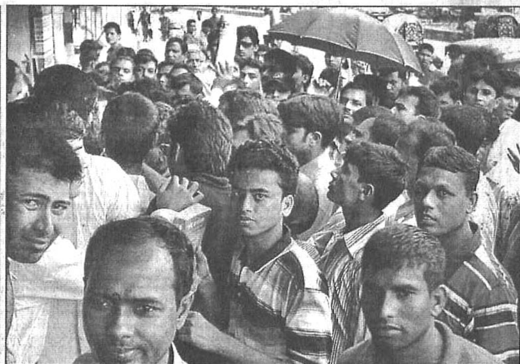
Home-bound people scramble for ticket at the BRTC bus stand on Rail Station Road in Chittagong yesterday.

He was sent to jail when police produced him before the court under the EPR yesterday.