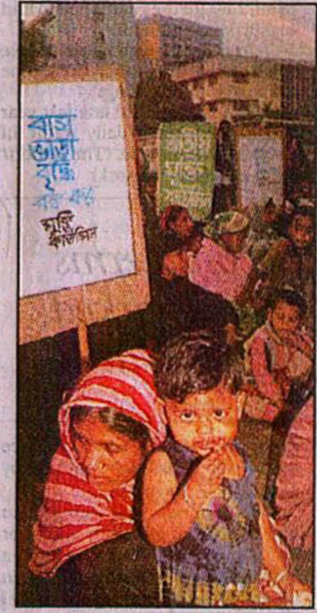
National Liberation Council stages a demonstration at Muktangan in the city yesterday to press for its various demands.