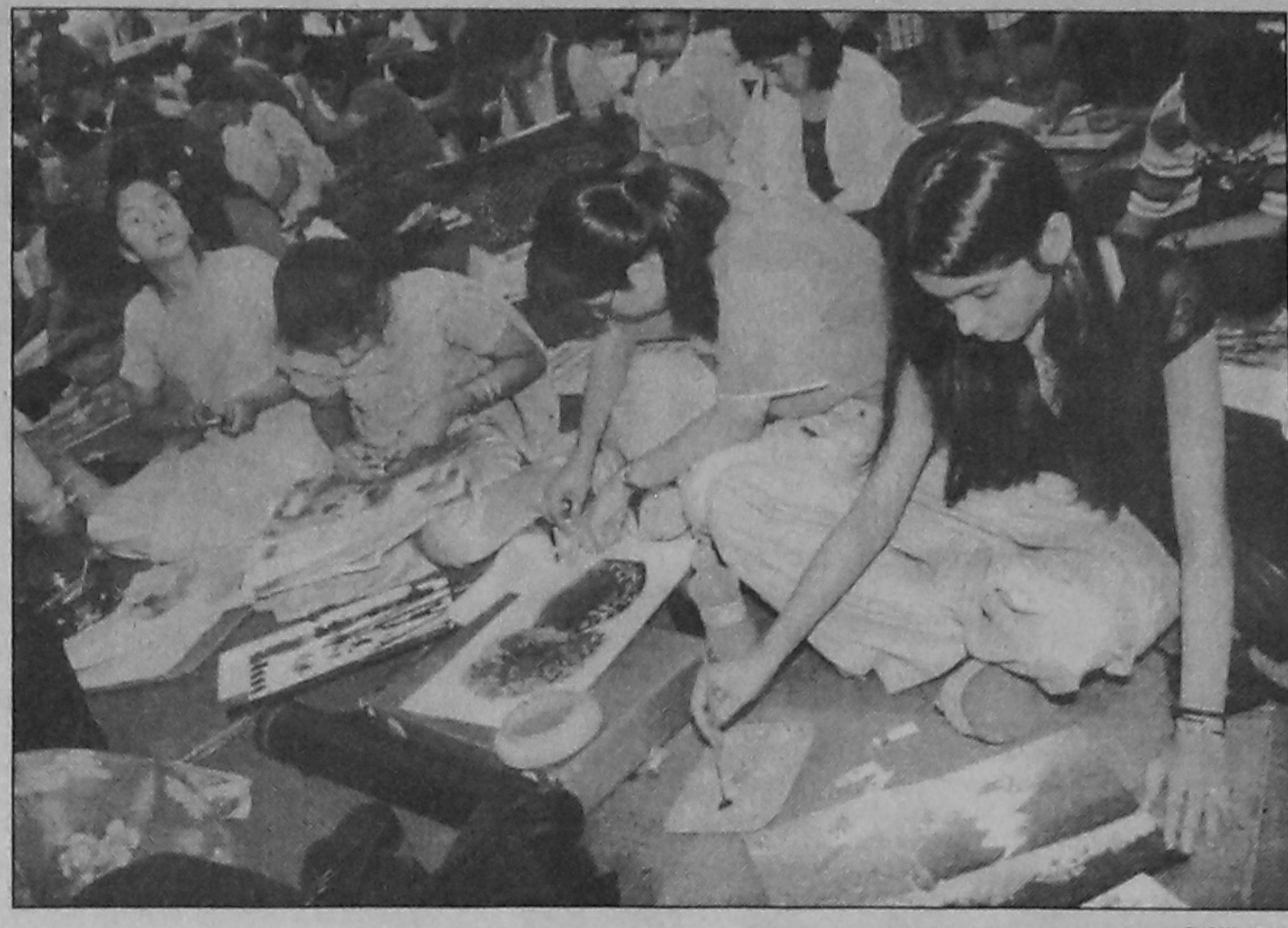
The Shanta-Mariam Foundation organised a drawing competition for children at its Uttara campus in the city yesterday.