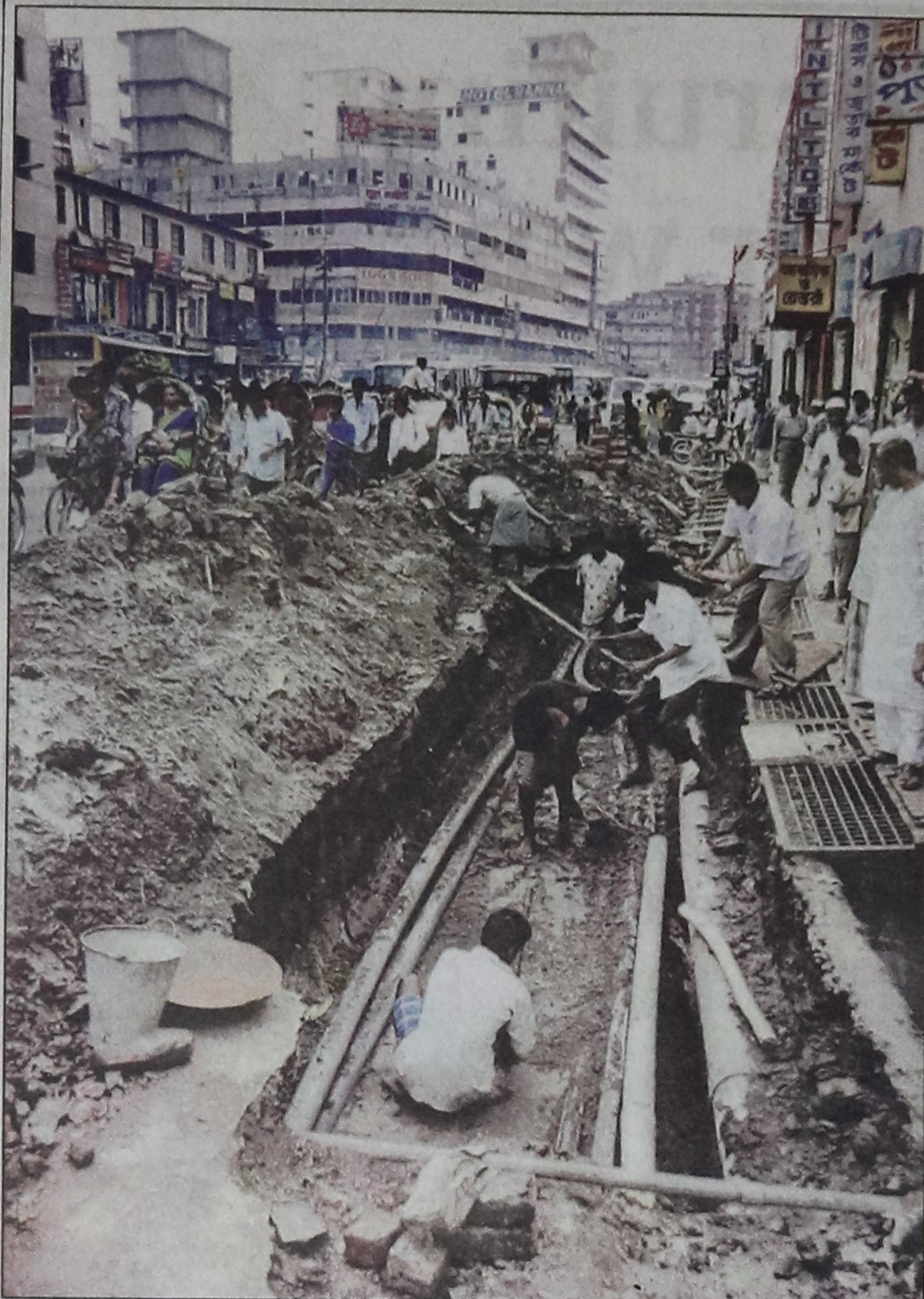
The slow pace of the work on laying sewers by digging roads at zero point of Bangabandhu Avenue under the supervision of Dhaka City Corporation is causing serious traffic jam and untold sufferings to pedestrians.

The seized goods and the arrested persons were handed over to appropriate authorities for legal action.