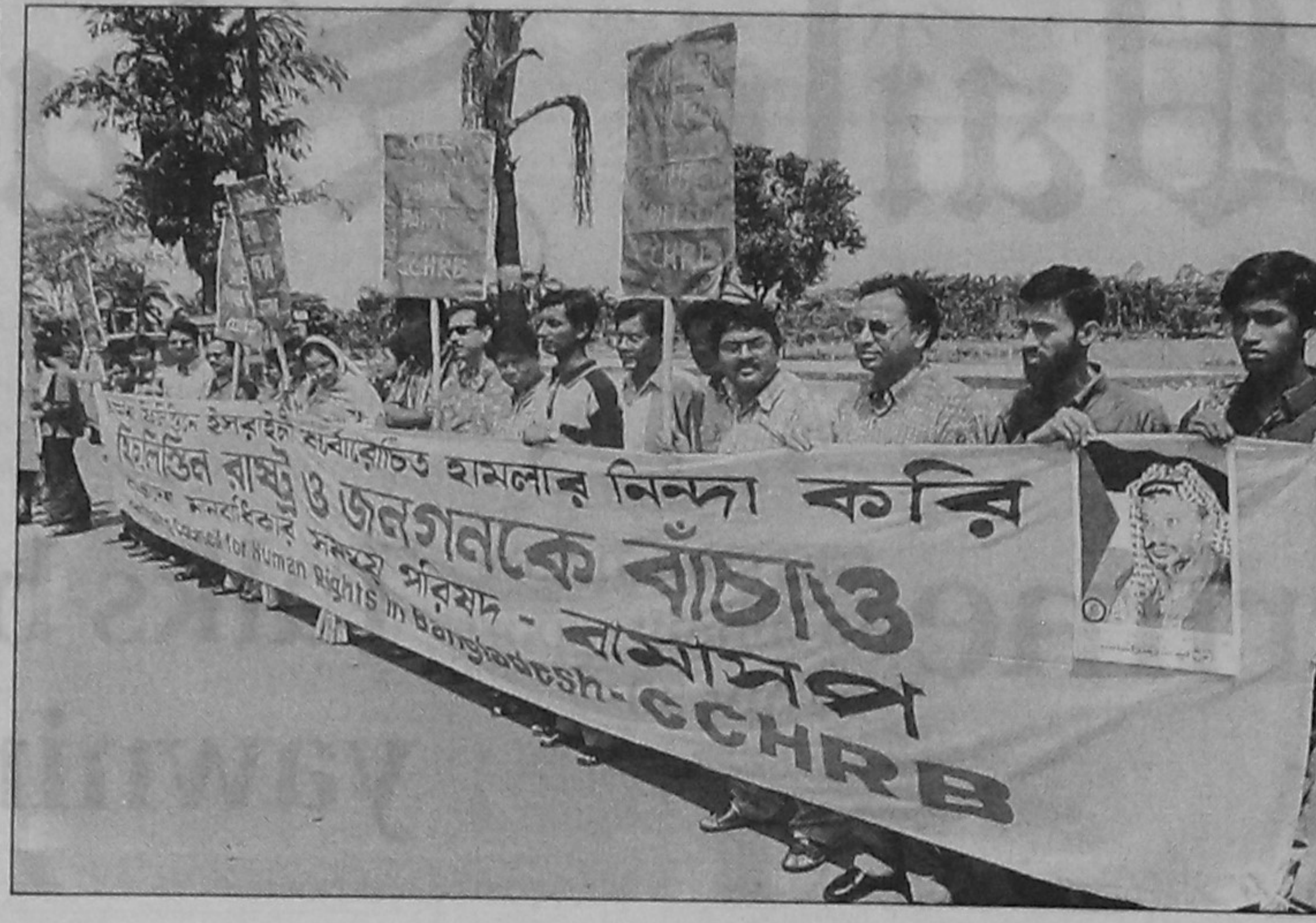
The Coordinating Council for Human Rights in Bangladesh (CCHRB) staged a peaceful protest in front of the Sangsad Bhaban in the city yesterday condemning Israeli offensive in the Palestinian territories.