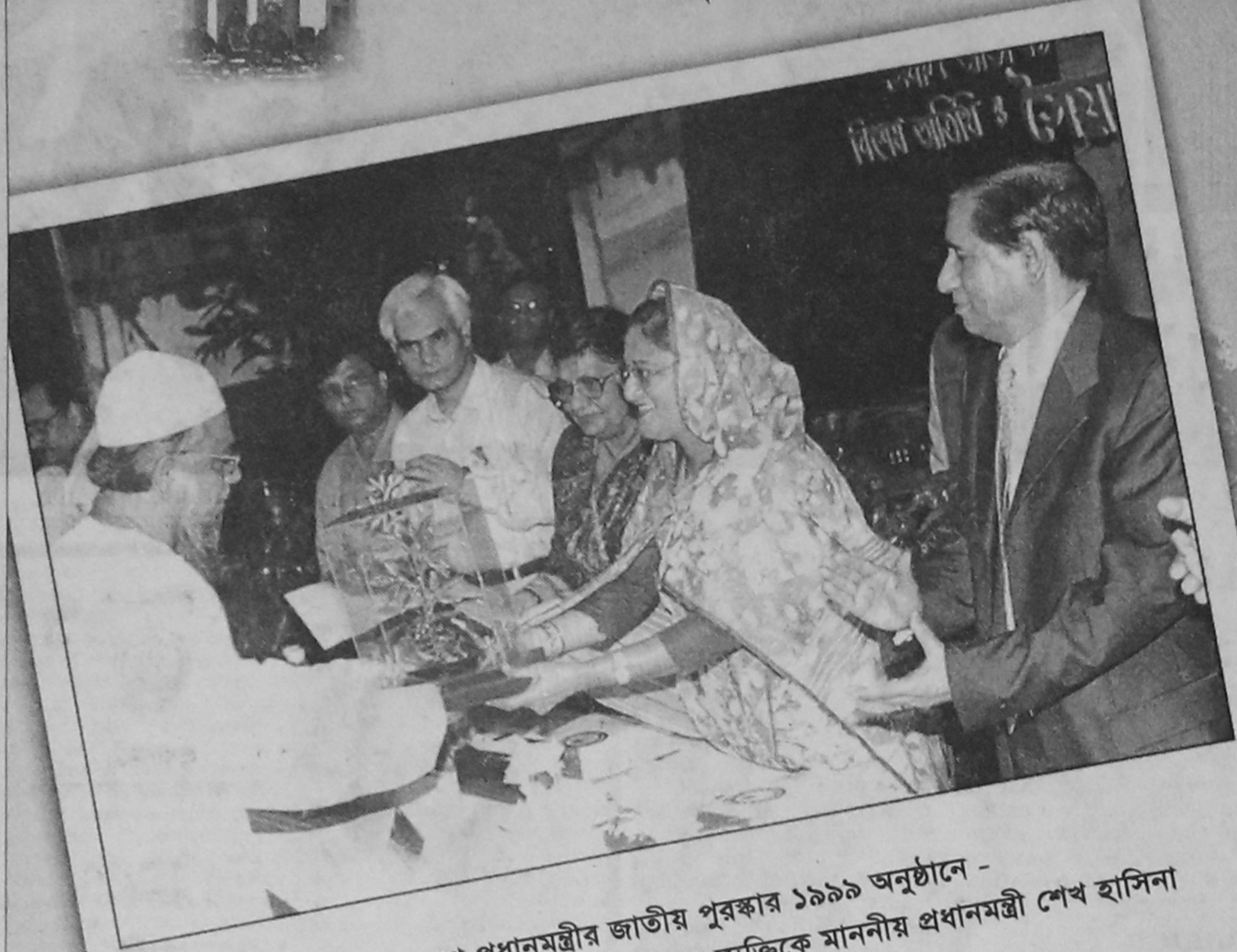
বৃক্ষরোপণে প্রধানমন্ত্রীর জাতীয় পুরস্কার ১৯৯৯ অনুষ্ঠানে - বৃক্ষরোপণে বিশেষ অবদান রাখার জন্য জনৈক ব্যক্তিকে মাননীয় প্রধানমন্ত্রী শেখ হাসিনা জাতীয় পুরস্কার প্রদান করছেন।