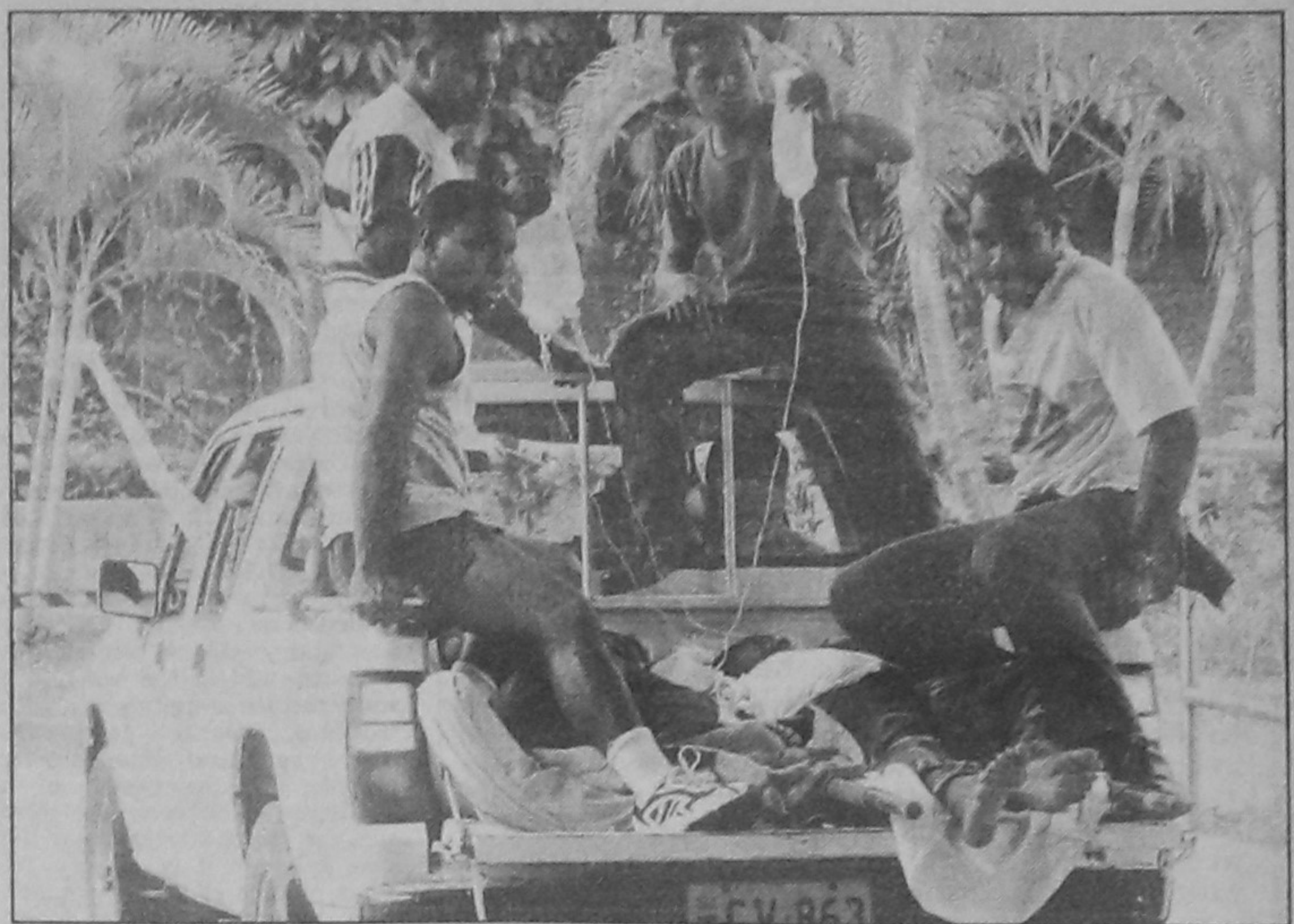
Wounded soldiers are transferred on a pick-up van in Suva yesterday after a mutiny by soldiers have left two dead and 10 wounded while senior military officers have been taken hostage. The new crisis, associated with a coup in Fiji earlier this year, began at 1 pm when soldiers from the Counter Revolutionary Warfare unit seized part of the headquarters of the Fiji Military Forces.

Relations between the two countries deteriorated sharply last year when Australia led an international peacekeeping force to end bloody militia violence in East Timor after the province voted for independence from Indonesia. "God willing, I will visit Australia at the end of this month to explain everything about our relationship," he told a group of regional parliamentarians during a meeting at the presidential palace in Jakarta.