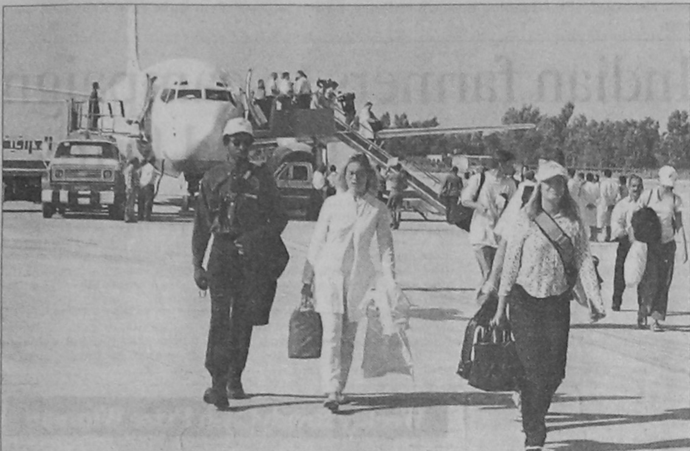
A French delegation of 75-member including some 30 medical staff and the same number of athletes arrive aboard the first Paris-Baghdad flight, since a UN embargo was imposed in 1990, at Baghdad Saddam International Airport on Friday. The Euralair charter flight (background) left Paris after France ignored a UN request to delay the departure of what the organisers insisted was a humanitarian flight.

The clinics involved are the private Hampshire Clinic, in Basingstoke, south of London, and the nearby North Hampshire Hospital.