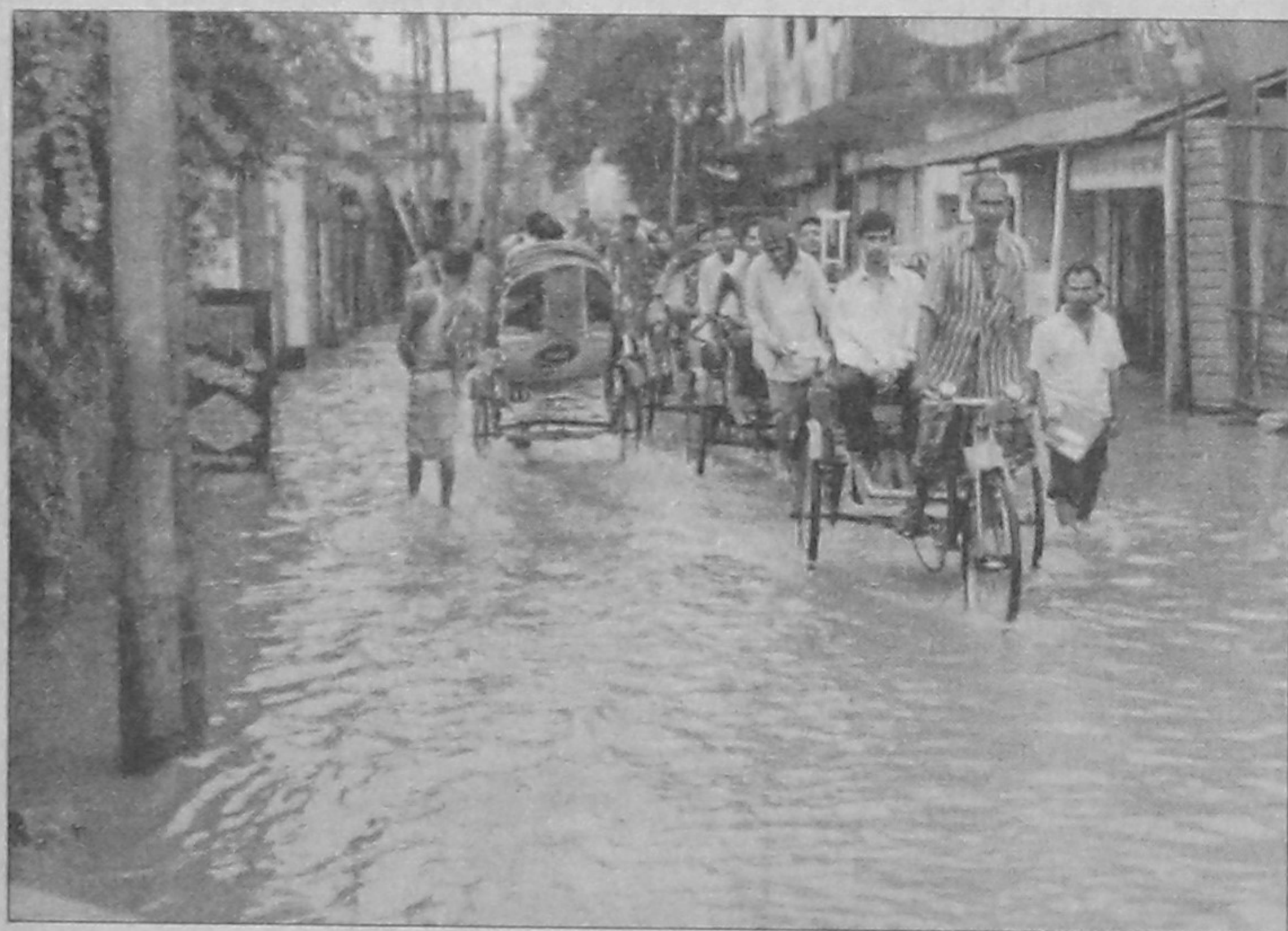
This is the scene of Badurtala Road in the heart of Bogra town just after moderate rainfalls. Pedestrians have to suffer a lot due to faulty drainage system. But who cares?