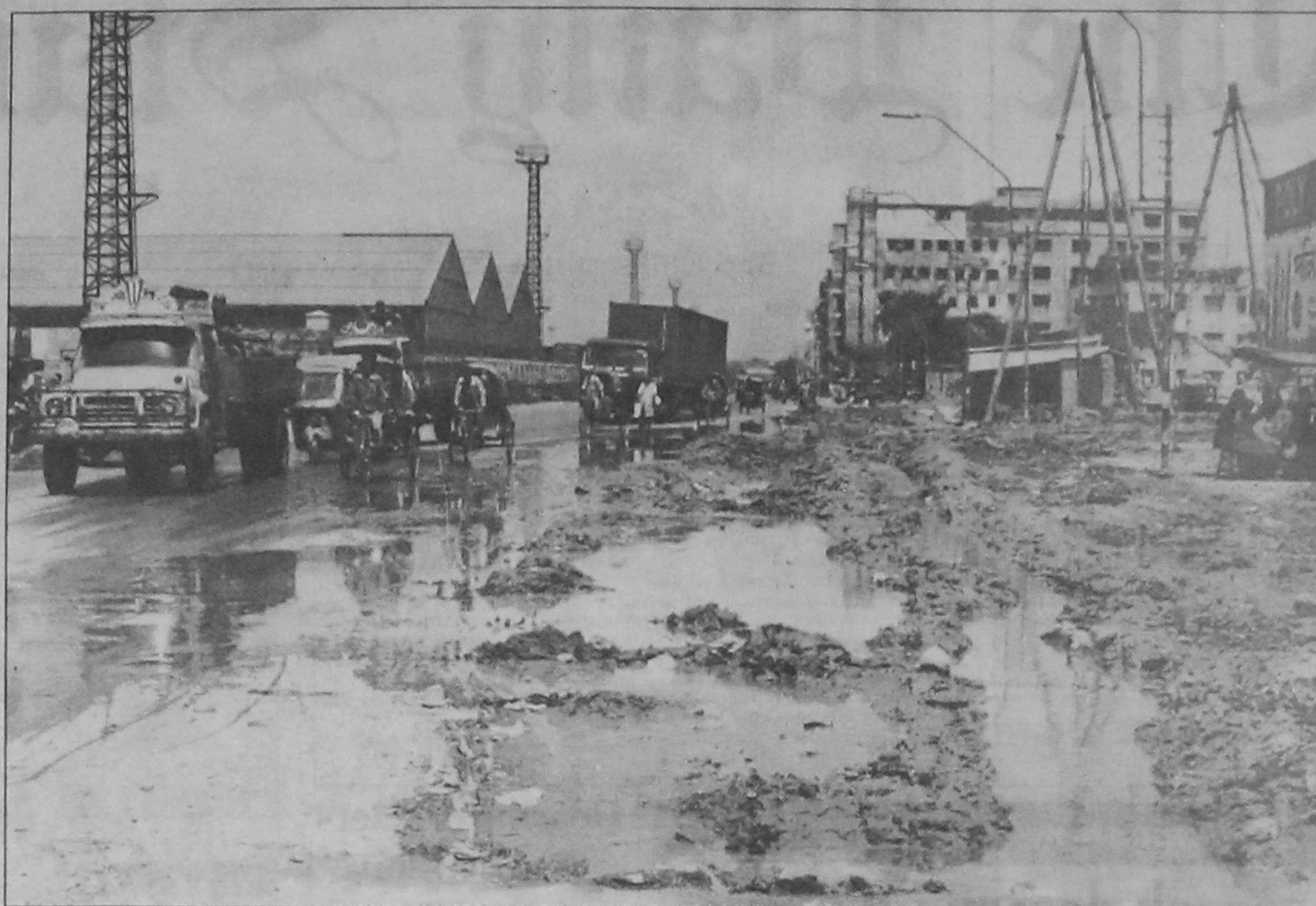
The mud seen on this road is not caused by the seasonal rains. The water runs off from the construction site of Kamalapur stadium nearby keeps the road muddy, causing continuous suffering to the users of the road each day.

Friends Bangladesh-USA will construct a two-storied community clinic where 200 distressed women and children will get different medical facilities including free medicine, said a press release.