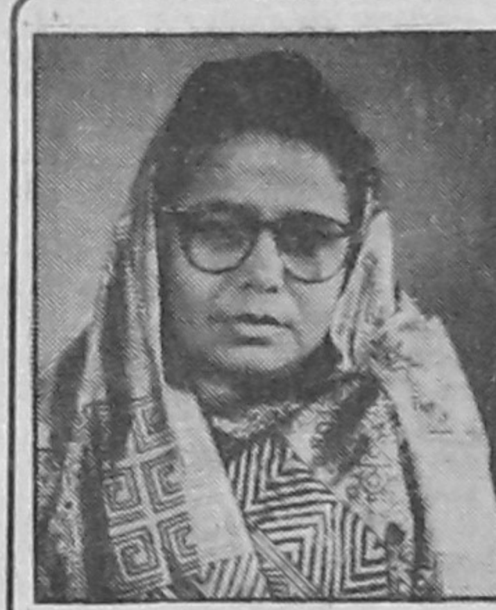
প্রতিমন্ত্রী মহিলা ও শিশু বিষয়ক মন্ত্রণালয় গণপ্রজাতন্ত্রী বাংলাদেশ সরকার বাণী

সারাদেশে নবম মাতৃদুগ্ধ সপ্তাহ ২০০০ উদযাপিত হচ্ছে। এবারের প্রতিপাদ্য বিষয় হলো "মাতৃদুগ্ধঃ আপনার অধিকার"। এই দিনে বিশ্বের সকল মাতৃদুগ্ধদানকারী মাকে বিশেষ করে কর্মজীবী মায়ের আমি অধিকারকে বিস্তৃতভাবে তুলে ধরা হচ্ছে।