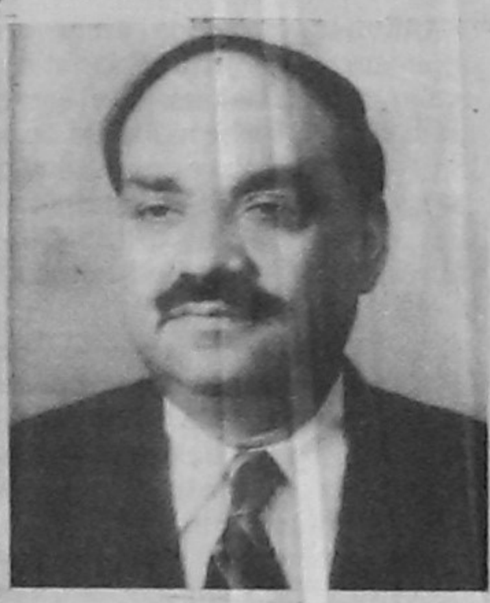
প্রতিমন্ত্রী স্বাস্থ্য ও পরিবার কল্যাণ মন্ত্রণালয় গণপ্রজাতন্ত্রী বাংলাদেশ সরকার বাণী

সুস্বাদু অম্লত্বহীন বিশেষ নিয়ামত। আর খাদ্য ও পুষ্টি সুস্থতার মৌলিক উপাদান। সুস্থ জাতি গঠনে উন্নত পুষ্টির ভূমিকা অপরিহার্য। বর্তমানে বাংলাদেশে অপুষ্টি জনিত সমস্যা অন্যতম প্রধান সমস্যা হিসাবে চিহ্নিত হয়েছে। পুষ্টিহীনতার কারণে হাজার হাজার শিশু অকালে প্রাণ হারায় এবং মেধাহীন ও দুর্বল জাতি হিসেবে বেড়ে ওঠে।