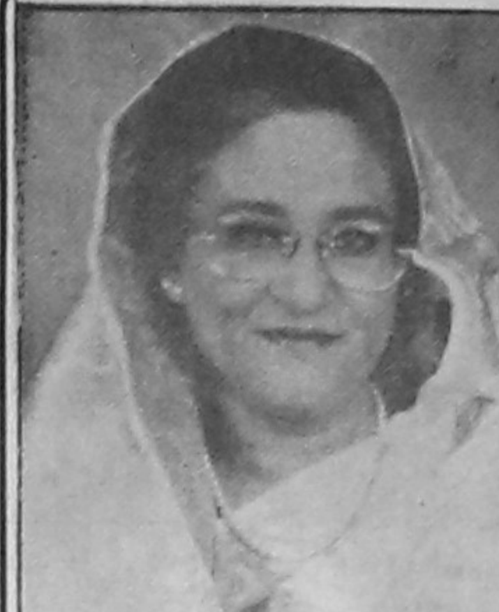
প্রধানমন্ত্রী গণপ্রজাতন্ত্রী বাংলাদেশ সরকার বাণী

মা ও শিশু স্বাস্থ্য সুস্বাদু মায়ের দুধ খাওয়ানোর ভূমিকা অপরিহার্য। শিশুর স্বাভাবিক বৃদ্ধি ও পরিপূর্ণ বিকাশে মায়ের দুধ আদর্শ খাদ্য। শিশুকে ছয়মাস বয়স পর্যন্ত শুধুমাত্র বুকের দুধ খাওয়ানো এবং পরিপূর্ণ খাবারের সাথে দু'বছর পর্যন্ত মায়ের দুধ খাওয়ানো মায়ের জন্য অবশ্যপালনীয় কর্তব্য হিসেবে বিবেচনা করতে হবে।