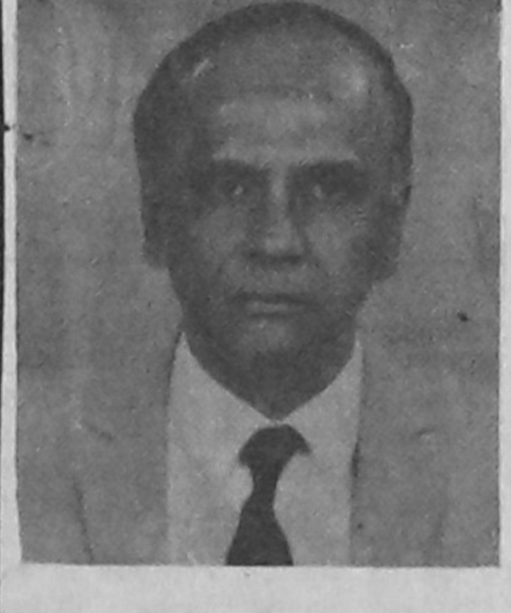
সচিব স্বাস্থ্য ও পরিবার কল্যাণ মন্ত্রণালয় গণপ্রজাতন্ত্রী বাংলাদেশ সরকার

মায়ের দুধ শিশুর শ্রেষ্ঠ খাবার। মায়ের দুধ পান করা যেমন প্রতিটি শিশুর অধিকার, তেমনি প্রতিটি মায়েরও অধিকার রয়েছে মাতৃদুগ্ধদানের। মা ও শিশুর এ অধিকার প্রতিষ্ঠা ও সংরক্ষণে মাতৃদুগ্ধদানকে অস্বীকার করা হয়েছে মানবাধিকারের গুরুত্বপূর্ণ অংশ হিসেবে।