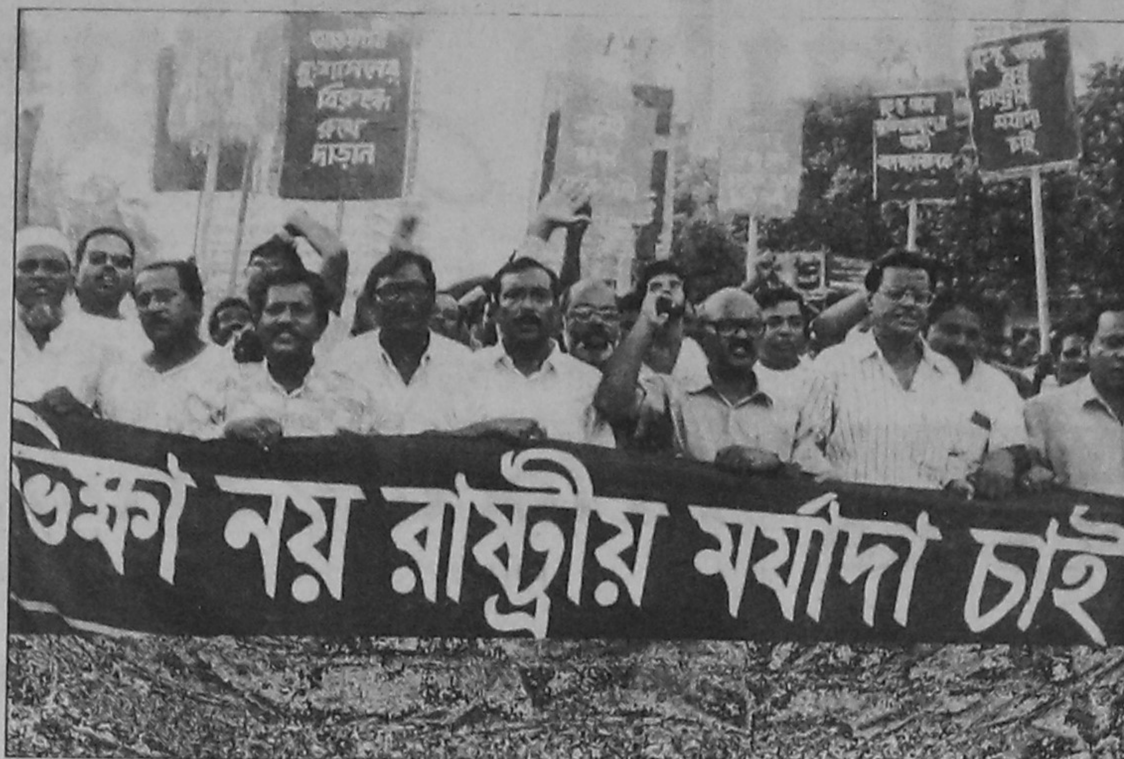
Muktijoddha Sangsad Central Coordination Council brought out a procession from city's Mukhtangon yesterday in support of their various demands.