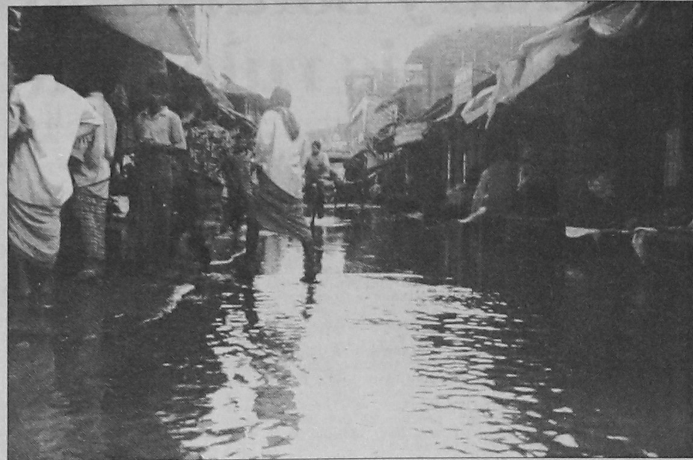
Water remains stagnant in Tangail town even after moderate rain due to faulty drainage system. Photo shows the submerged Tulapaty Road after a downpour recently. This picture has been taken by a correspondent in Tangail. —Star photo

Farazi Azmal Hossain is local correspondent of the Ittefaq, while Motinuzzaman is local correspondent of the Ajker Kagoj.