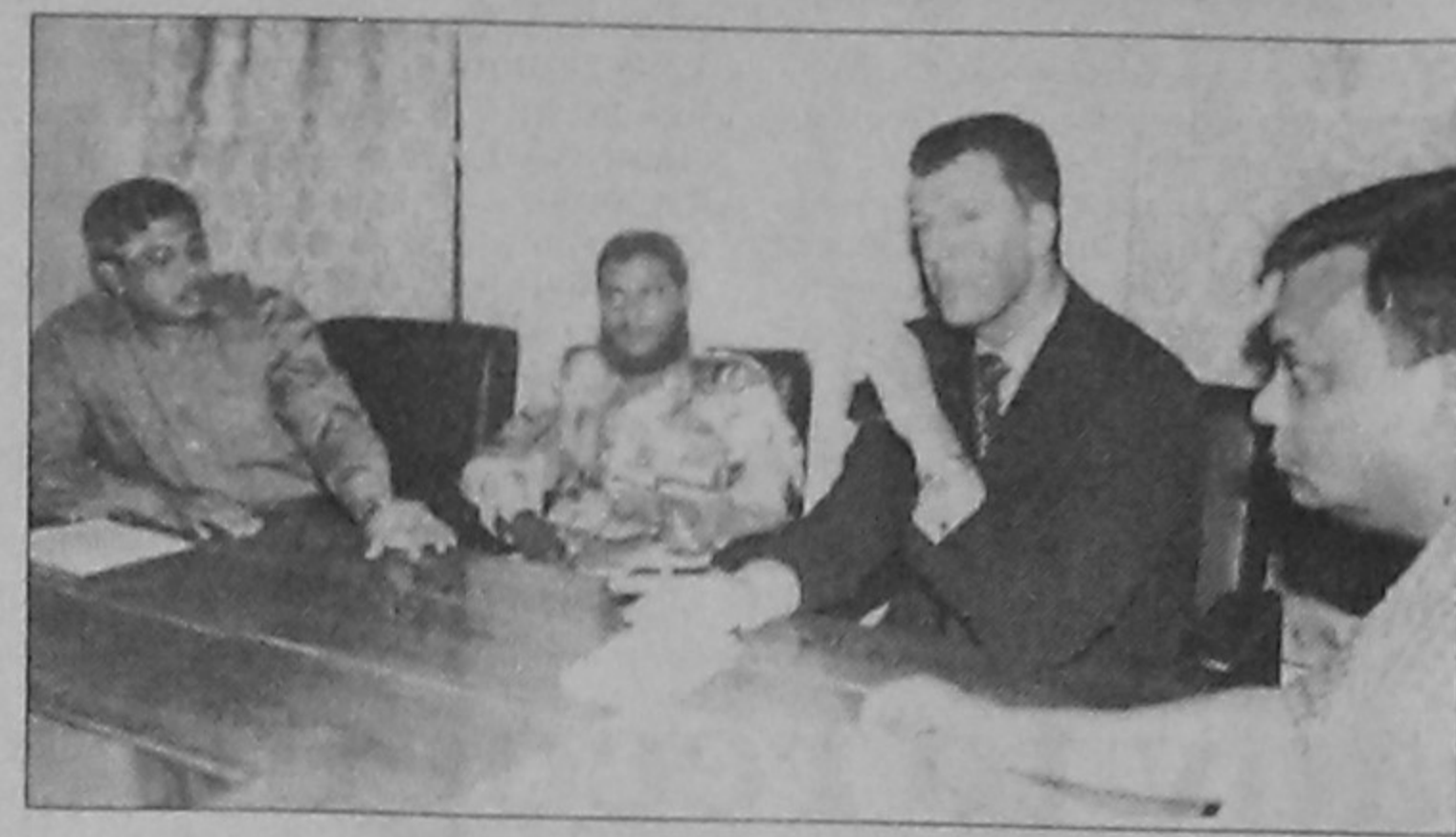
Visa service improved