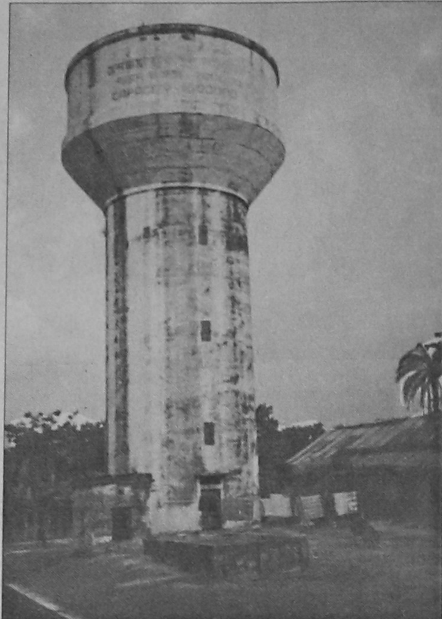
Scarcity of water

About three years ago, a proposal to setup a water treatment plant in the town was placed to the higher authority. But nothing has been done so far in this regard.