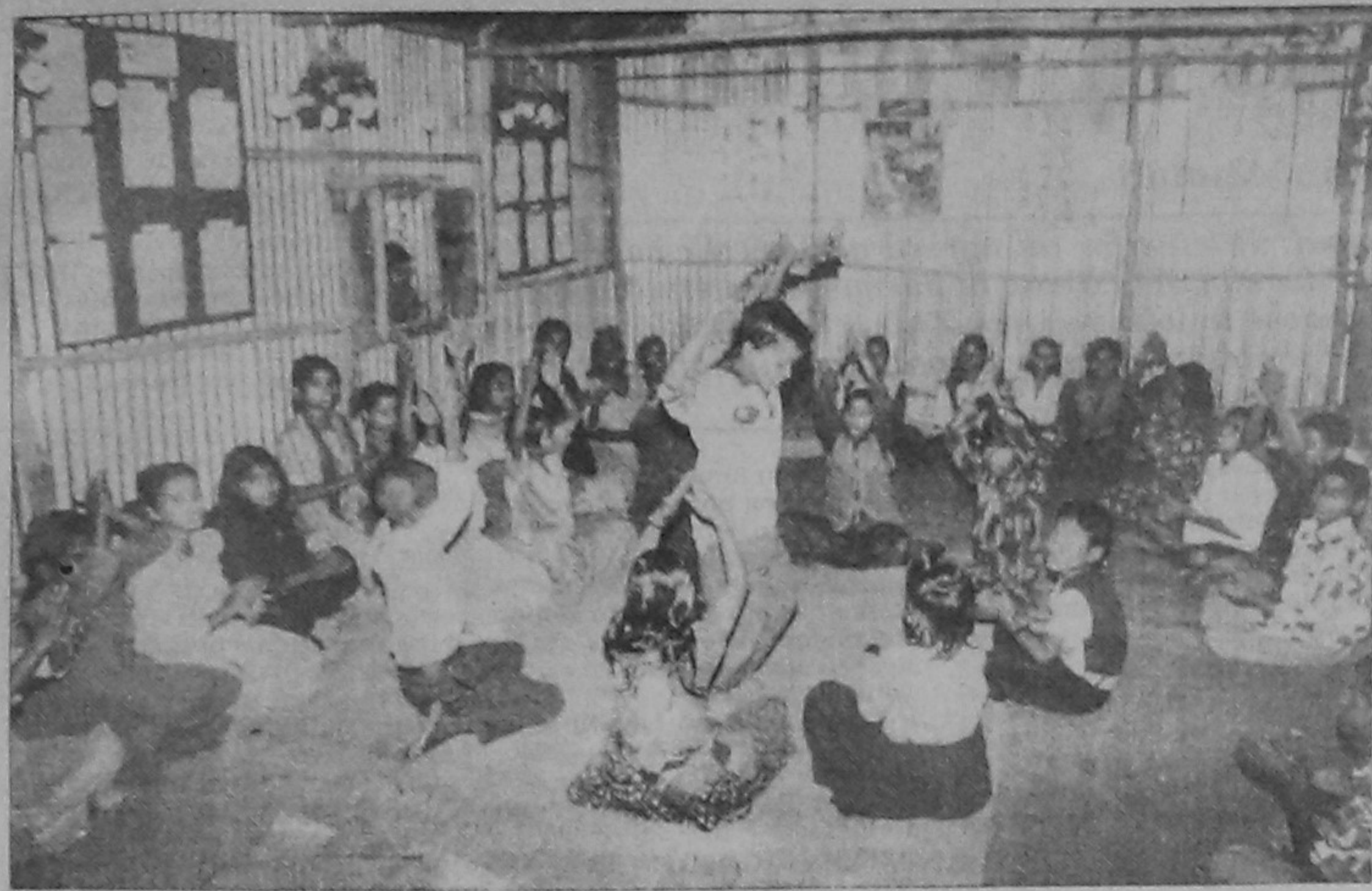
Children at a school run by BRAC at Joypara village in Dhamrai practising a dance item they will present in front of US President Bill Clinton during his visit.