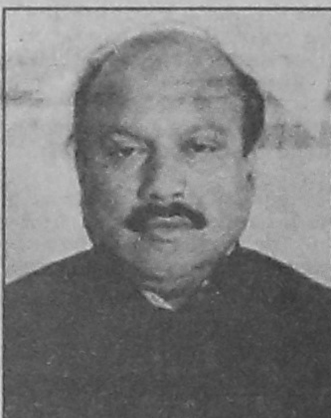
মন্ত্রী স্বরাষ্ট্র মন্ত্রণালয় গণপ্রজাতন্ত্রী বাংলাদেশ সরকার