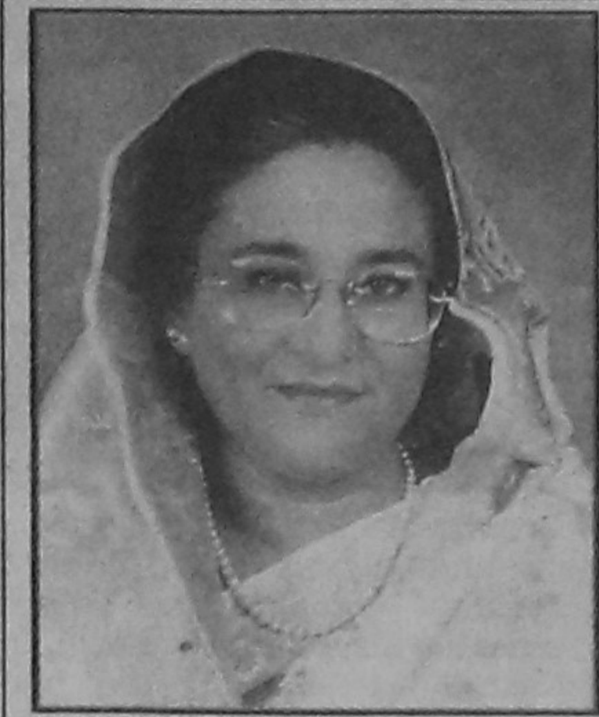
প্রধানমন্ত্রী গণপ্রজাতন্ত্রী বাংলাদেশ সরকার