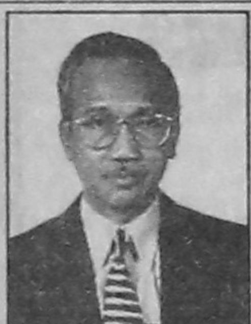
সচিব স্বরাষ্ট্র মন্ত্রণালয় গণপ্রজাতন্ত্রী বাংলাদেশ সরকার