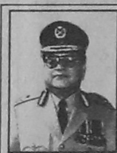
ইন্সপেক্টর জেনারেল অব পুলিশ বাংলাদেশ পুলিশ