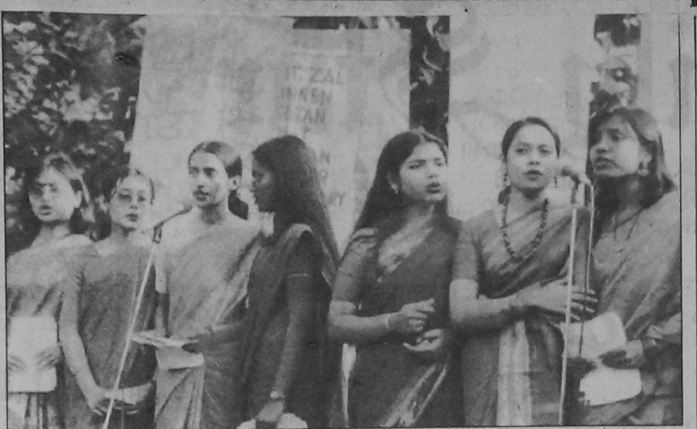
Artistes presenting recitation at a cultural function organised by Ekatattur Ghatak Dalal Nirmul Committee at the TSC road island on the Dhaka University campus yesterday.