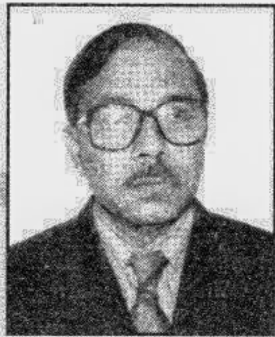
চেয়ারম্যান বাংলাদেশ তার ও টেলিকম বোর্ড

shebaworld - The GSM service of sheba telecom is on its way to be the indispensable source of its subscribers' competitive advantage.