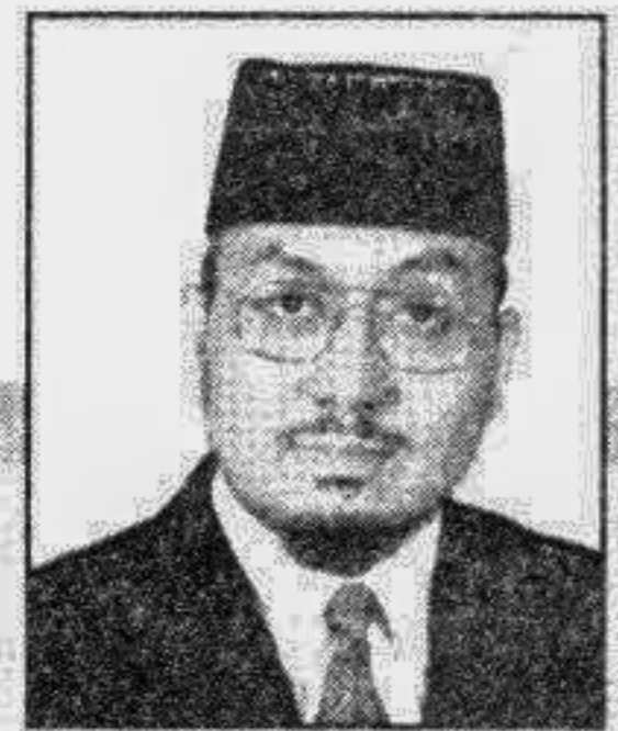
Managing Director Sheba Telecom (Pvt.) Ltd.

First and foremost, I would like to express my grateful to Almighty Allah on the celebration of Sheba Telecom's 4th anniversary in operation beginning with providing Rural Telecommunication Services in the southern parts of Bangladesh. In 1998 Sheba Telecom has started the commercial operation of its new shebaworld (GSM network) in the city of Dhaka.