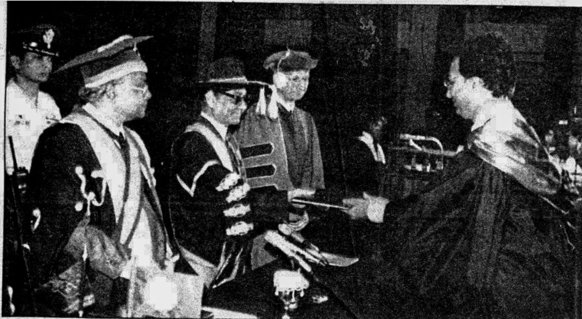
Chancellor and President Shahabuddin Ahmed distributed certificates among the graduates of the International University of Business Agriculture and Technology. The first convocation programme of IUBAT was held at the Osmani Memorial Hall in the city yesterday.