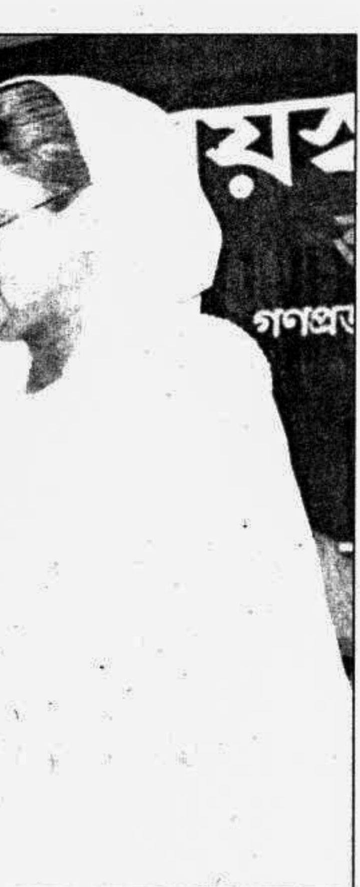
Prime Minister Sheikh Hasina handing over oldage allowance pass book to an aged man.

ment. A government of national consensus was formed by Awami League led by Sheikh Hasina, Daughter of Democracy and of the father of the Nation Bangabandhu Sheikh Mujibur Rahman with the commitment of restoring peoples right. Among other commitments the party had formulated prior to election that included imple - model progressive, upto date and well planned. Then they