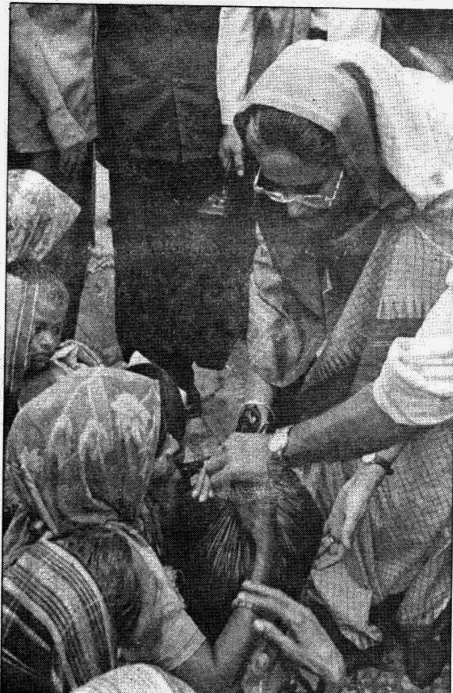
Prime Minister Sheikh Hasina distributing relief materials among flood victims.

ments they arranged farce of referendum and Presidential elections etc and thus destroyed the regular and real process of polling that continued for long 21 years. In the year 1996 the government of BNP was over-thrown by mass movement and Awami League came to power through election held under non party care taker govern-