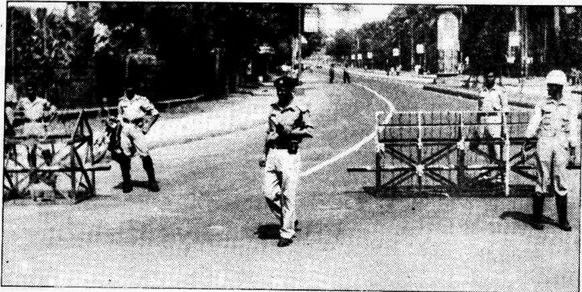
Security was tightened at all points leading to the Dhaka University campus yesterday prior to the Prime Minister's visit to the campus to inaugurate the "Bangabandhu Chair" at the Department of History.