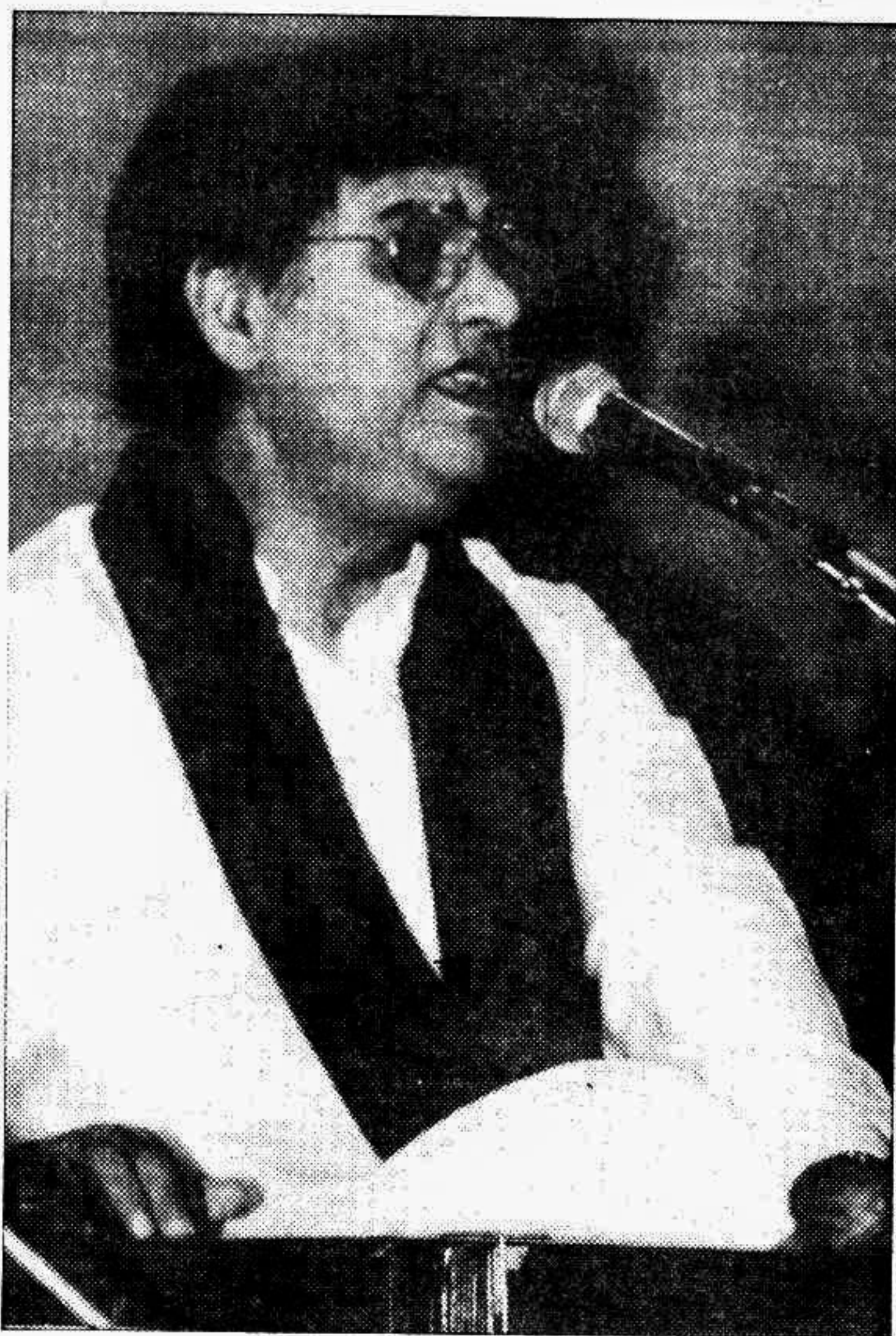
Renowned Indian Ghazal singer Jagjit Singh performing at a musical soiree at the Sheraton Hotel yesterday evening. His visit was arranged by Shetubandha, a cultural organisation to raise funds for distressed artists of the country.