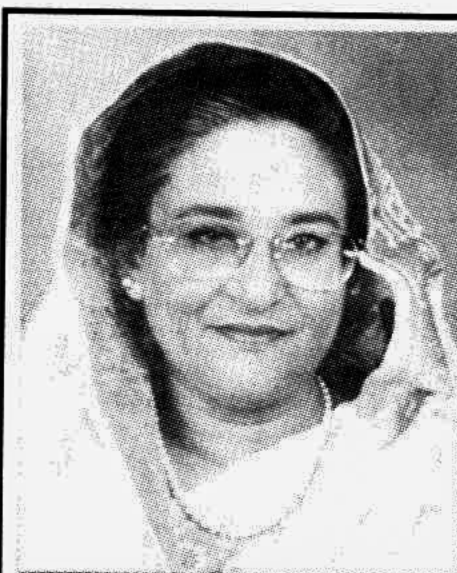
প্রধানমন্ত্রী গণপ্রজাতন্ত্রী বাংলাদেশ সরকার

19. Bangladesh Rifles, the tireless sentinel of the border, is totally committed to their sacred duties with the utmost sincerity, sense of dedication and deep patriotism. They have exhibited their devotion not only in the field of war or guarding border but they have also showed the same attitude of service to the victims of various natural calamities. Following the ideals of Bir Shreshtha Lance Naik Nur Muhammad Sheikh and Bir Shreshtha Lance Naik Munshi Abdur Rouf, a considerable number of members of the force have sacrificed their lives while performing their duties since the Liberation War. We pray for the eternal peace of those dedicated souls in this august "BDR Reunion '99". To maintain the traditional footprints of the predecessors the soldiers of Bangladesh Rifles are determined to perform their duties being infused with a deep sense of patriotism and dedication.