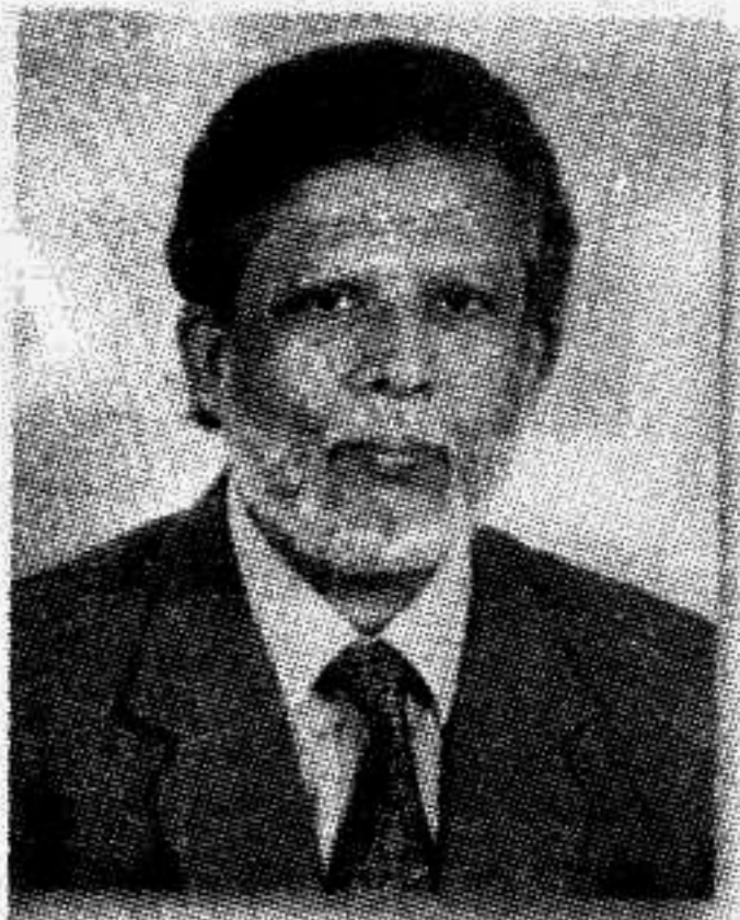
সচিব গণপ্রজাতন্ত্রী বাংলাদেশ সরকার