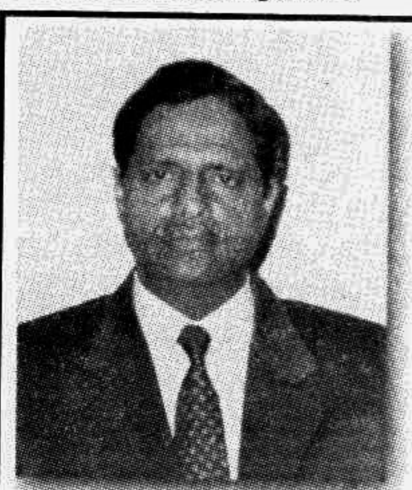
মন্ত্রী গণপ্রজাতন্ত্রী বাংলাদেশ সরকার

14. The BDR personnel are working with utmost sincerity in the on going peace process in Chittagong Hill Tracts after the signing of historic Peace Treaty. They have also extended necessary supports for the rehabilitation of the refugees with other agencies.