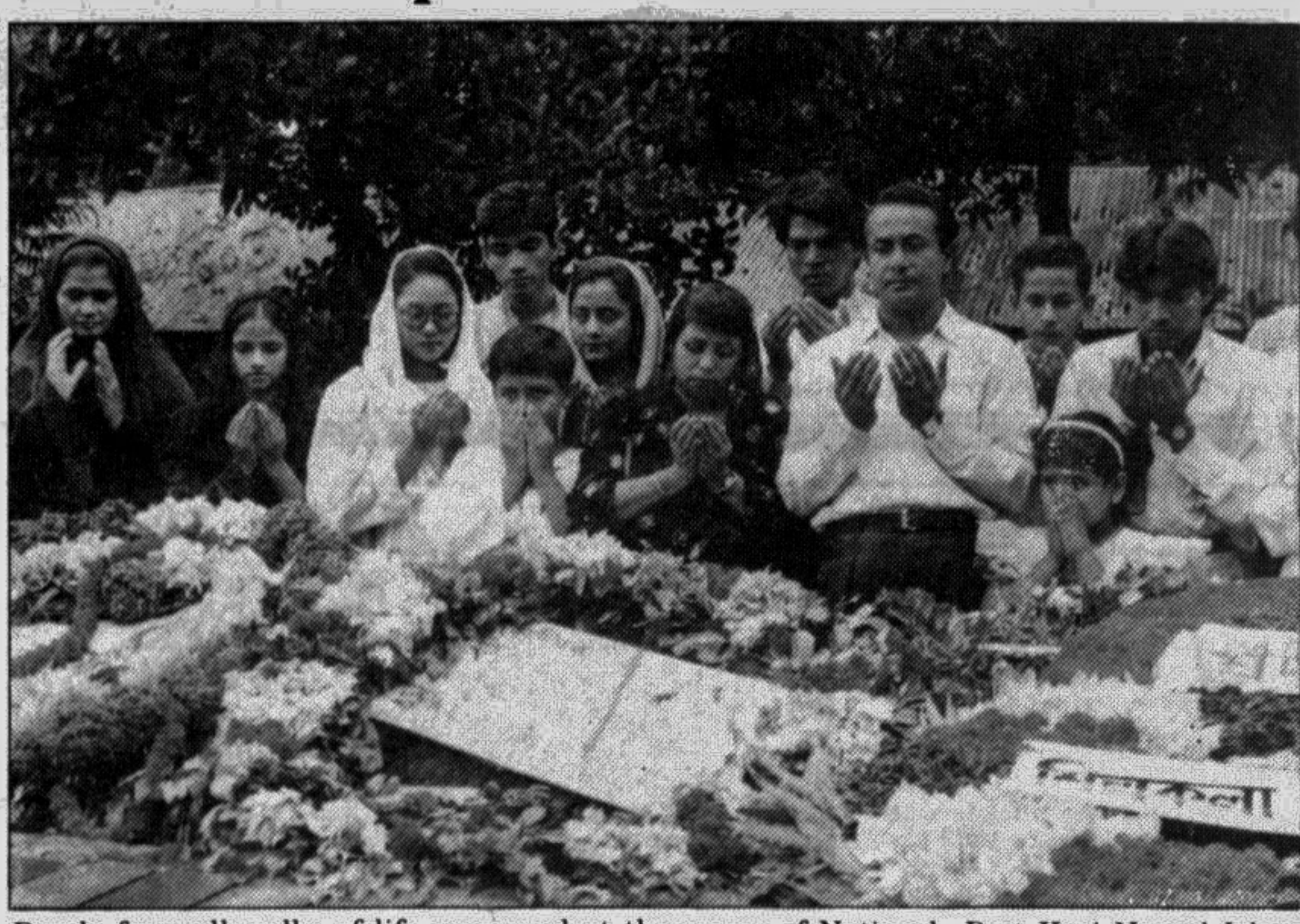
People from all walks of life converged at the mazar of National Poet Kazi Nazrul Islam yesterday to pay tributes by placing wreaths on the occasion of his 22nd death anniversary.

Weekly holidays of BTV employees cancelled Weekly holidays of all the officers and employees of Bangladesh Television (BTV) relating to broadcasting have been cancelled for the time being in view of severe flooding in the country, reports UNB. An announcement of the BTV authorities said the decision was taken to facilitate smooth dissemination of information of flood devastation and relief works. BTV has also introduced a special bulletin of flood at 7.30 pm from yesterday evening. Besides, BTV will carry out a number of programmes on flood devastation and other important messurers being taken by the government relating to flood.