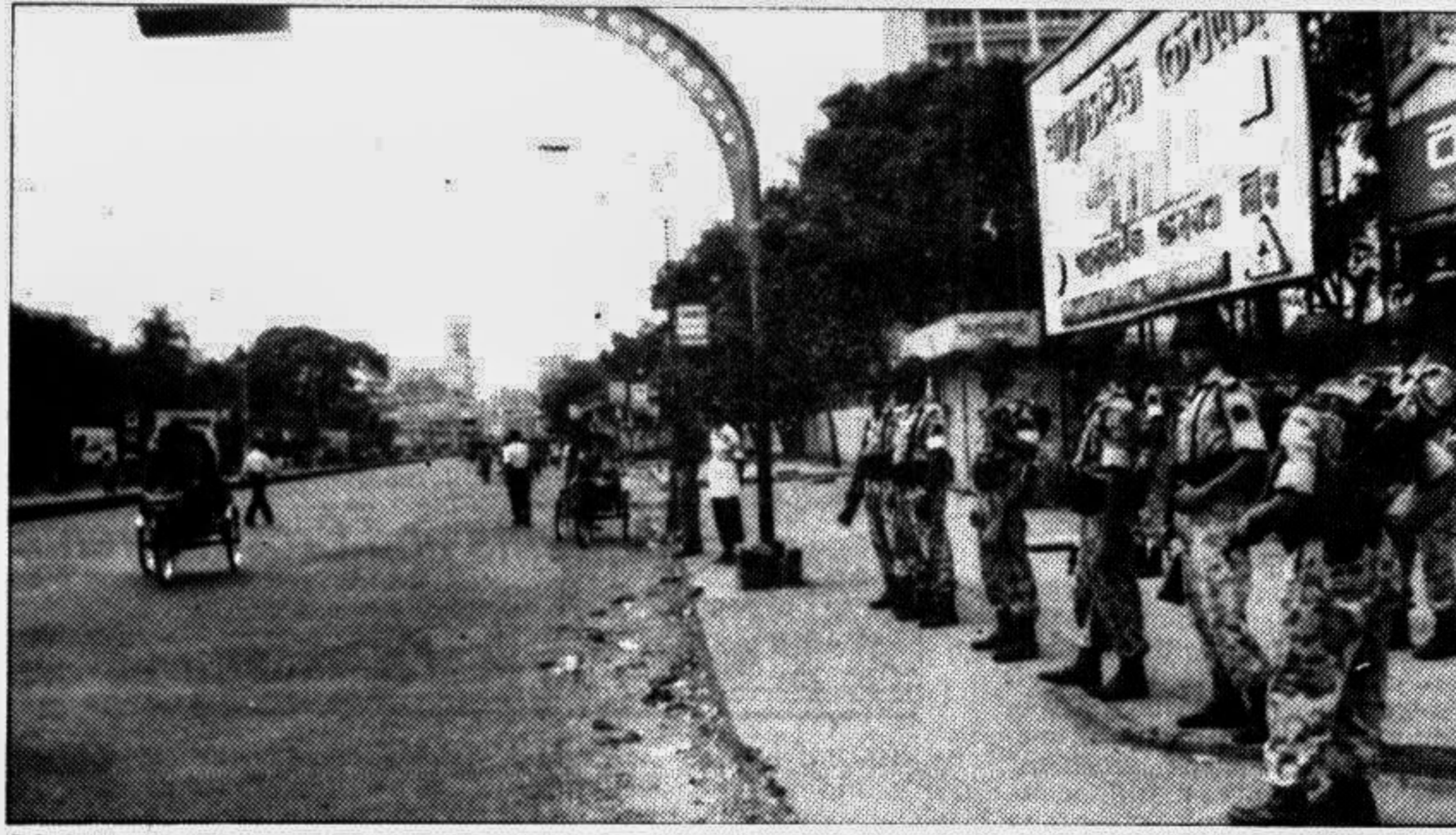
BDR personnel patrolled main city thoroughfares during yesterday's hartal hours. This photograph was taken at Paltan Square. Story on Page 1