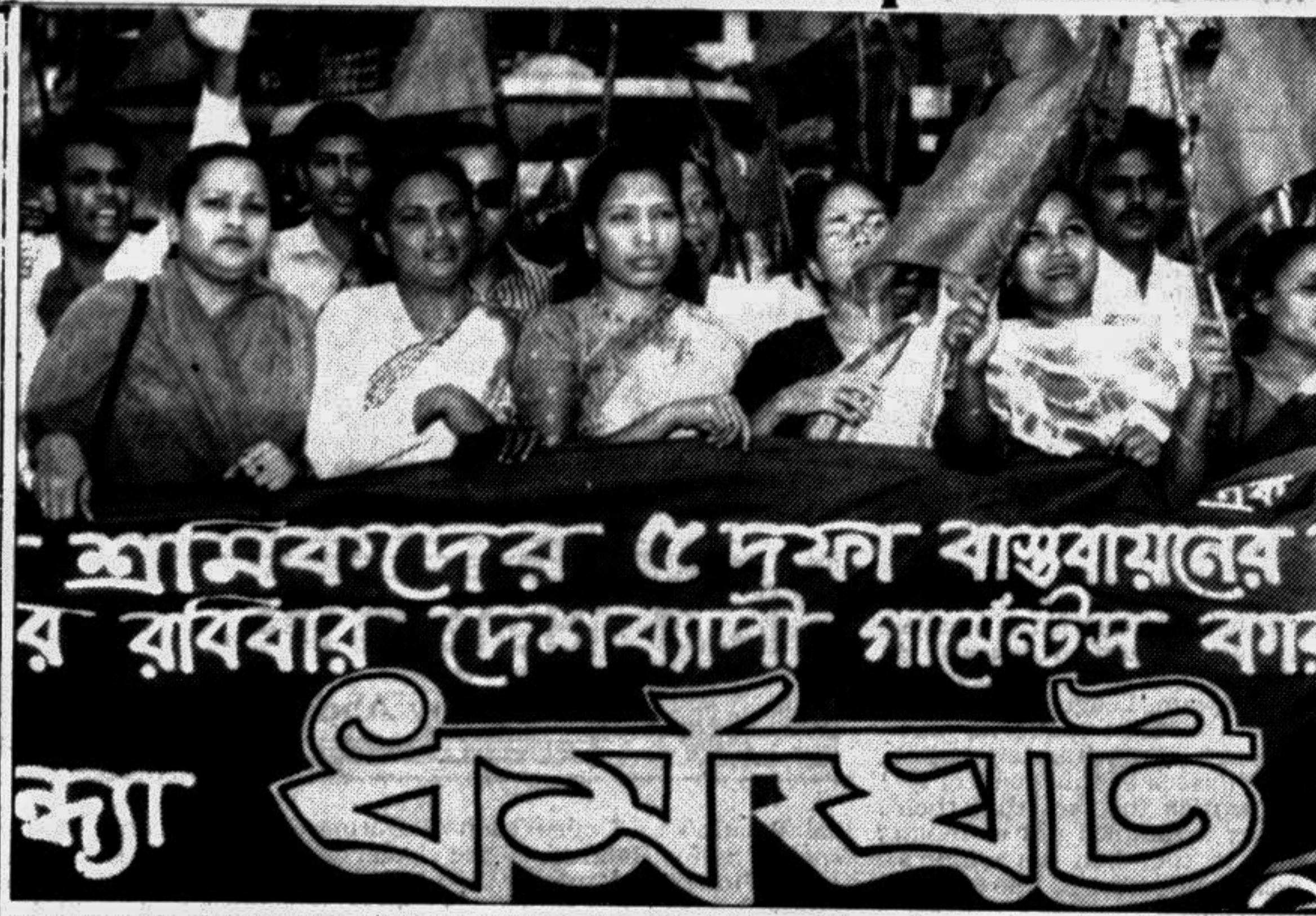
Bangladesh Garments Sramik Oikya Parishad brought out a procession in the city yesterday to drum up support for tomorrow's nationwide strike by garments workers.

Health Minister Salahuddin Yusuf lauded the services rendered by the field workers of family planning department with their untiring zeal in making government's family planning programme successful.