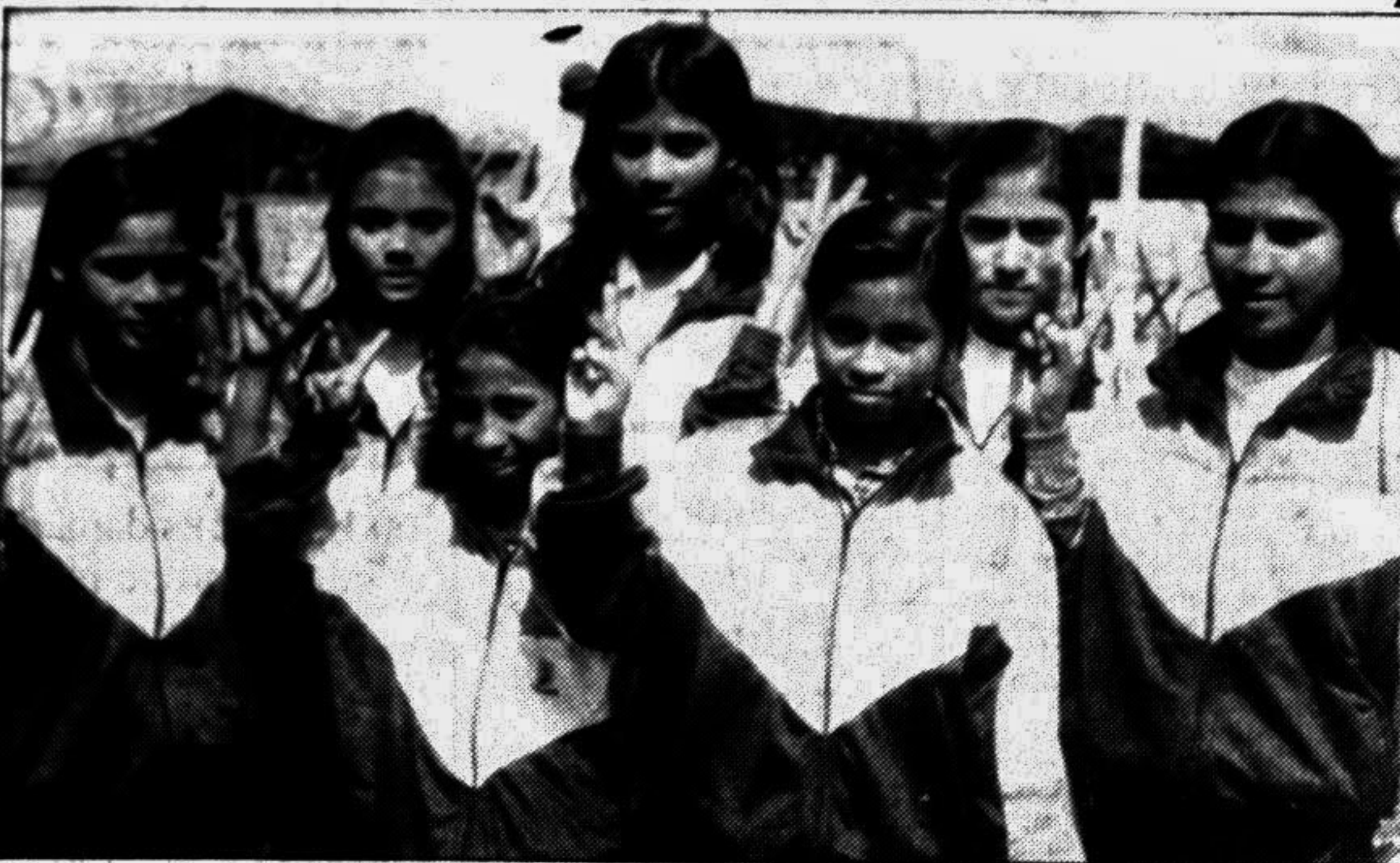
Members of the Narayanganj team who emerged champions in the age-group swimming championships for women that ended yesterday.