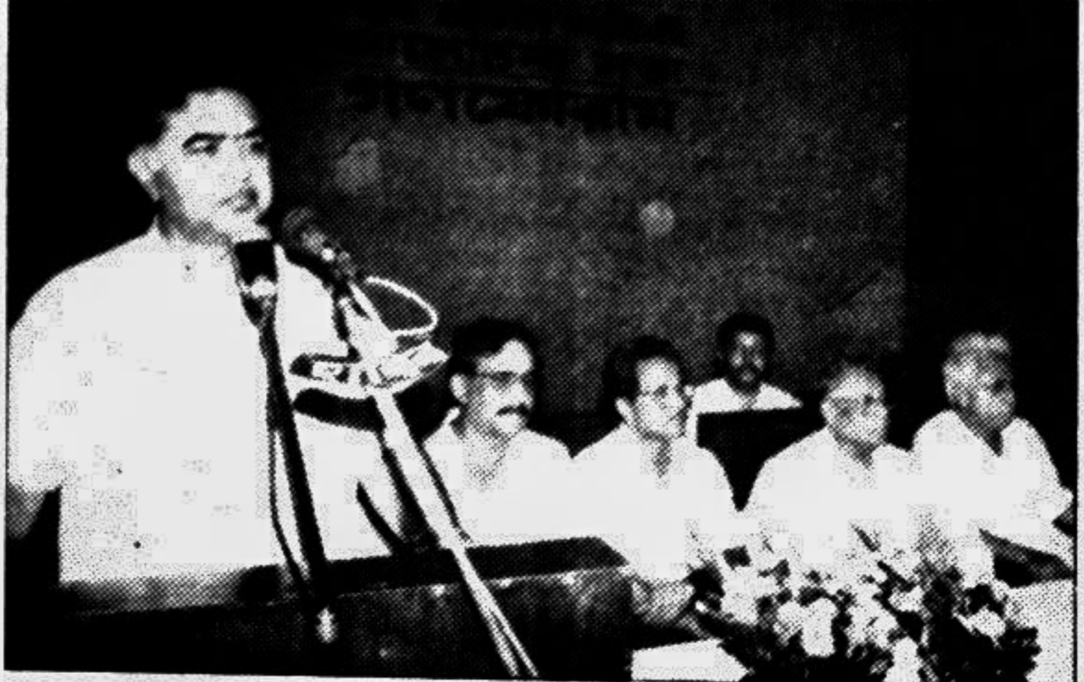
Gano Forum President Dr Kamal Hossain speaking at a discussion marking the fourth founding anniversary of the party at the Engineers Institute auditorium in the city yesterday.

The British Council presents MILES The British Council will organise a concert with MILES. The concert is open to the contacts/clients of Examinations Services (candidates who sat for A-Level and O-Level in June 1997), the Teaching Centre and Library. Date : Tuesday, 2 September 1997 Time : 5:00 pm Venue : National Museum Auditorium Price : Tk. 100 Tickets are available at the British Council Reception from 30 August to 02 September 1997 from 10:00 am - 3:30 pm. To purchase the tickets you MUST show either your Library Membership ID card or GCE O-Level/A-Level June 1997 admit card Tickets are limited.