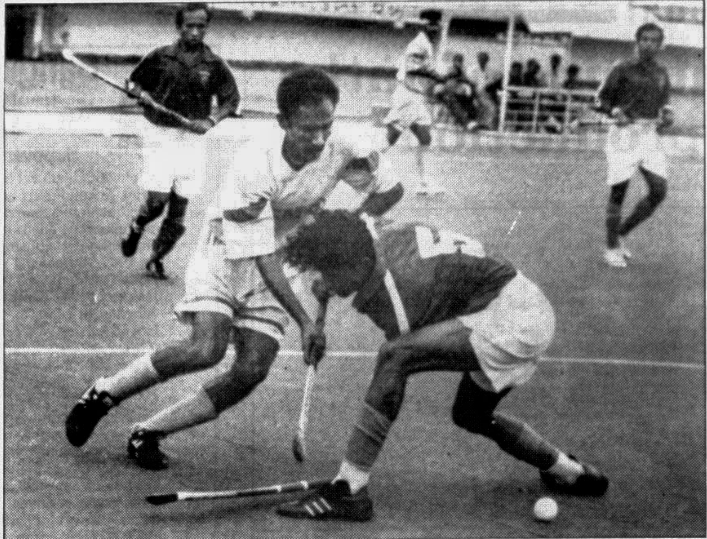
Scene from yesterday's Green Delta First Division league match between Abahani and Sonali Bank at the Hockey Stadium.