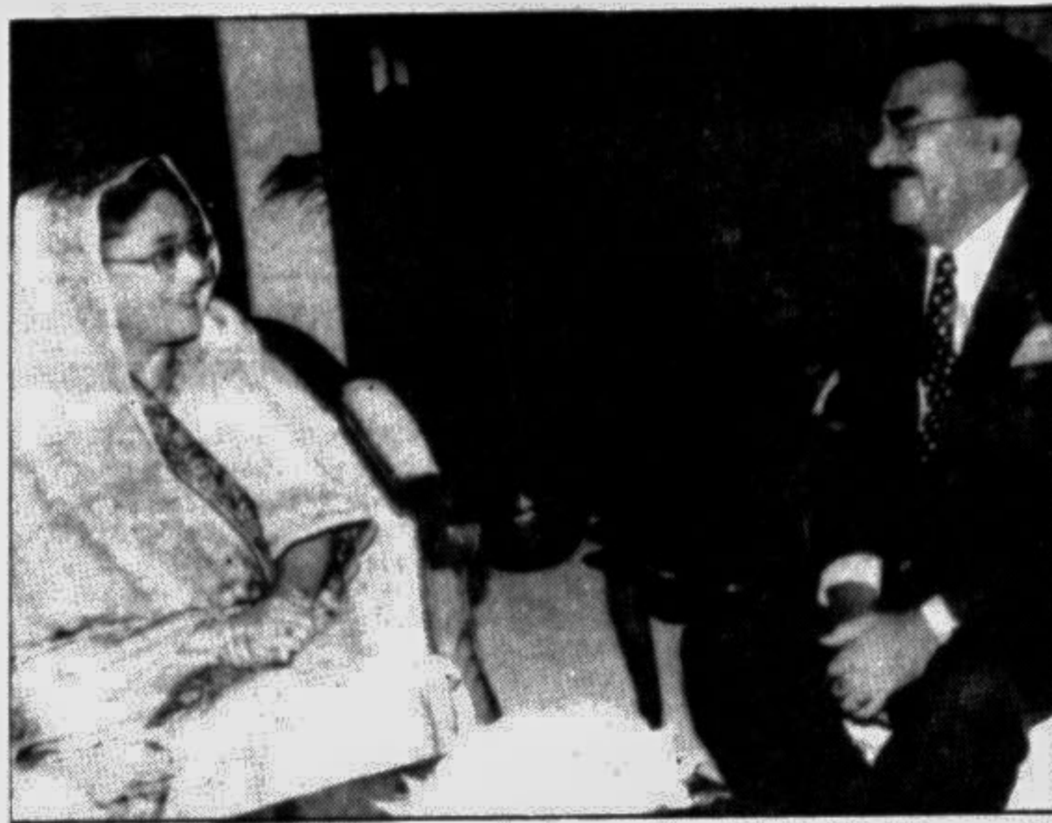
The outgoing Indonesian Ambassador Hadi Al Wayarabi called on Prime Minister Sheikh Hasina at her secretariat office yesterday.