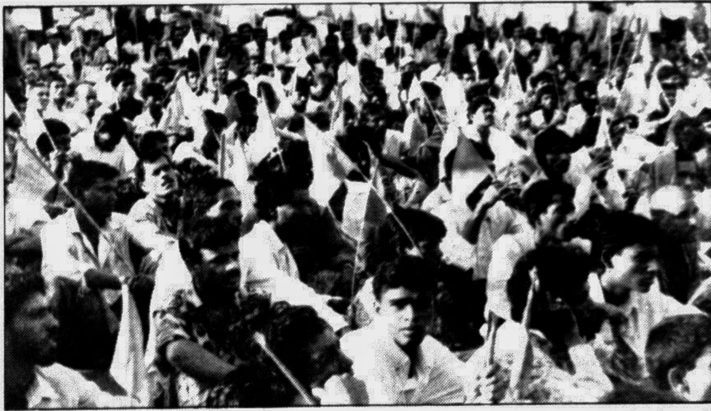
Jatiya Samrak Federation held a rally demanding formation of wages commission in front of the Jatiya Press Club yesterday.