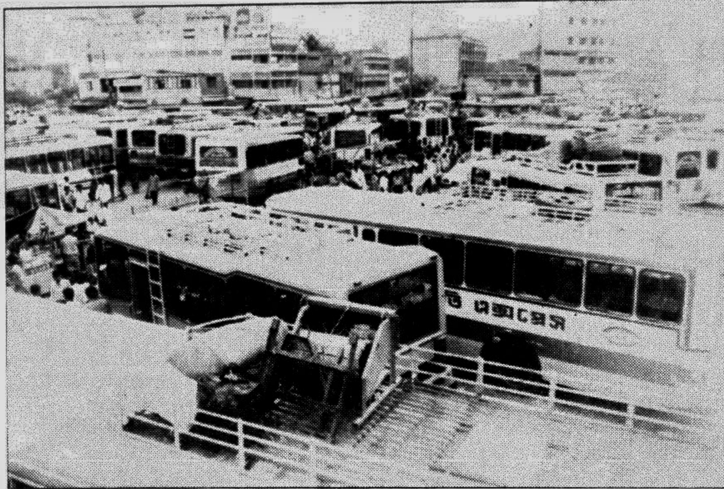
No Chittagong bound buses left the Saidabad Bus Terminal in the city as BNP called a dawn-to-dusk hartal in the port city yesterday.