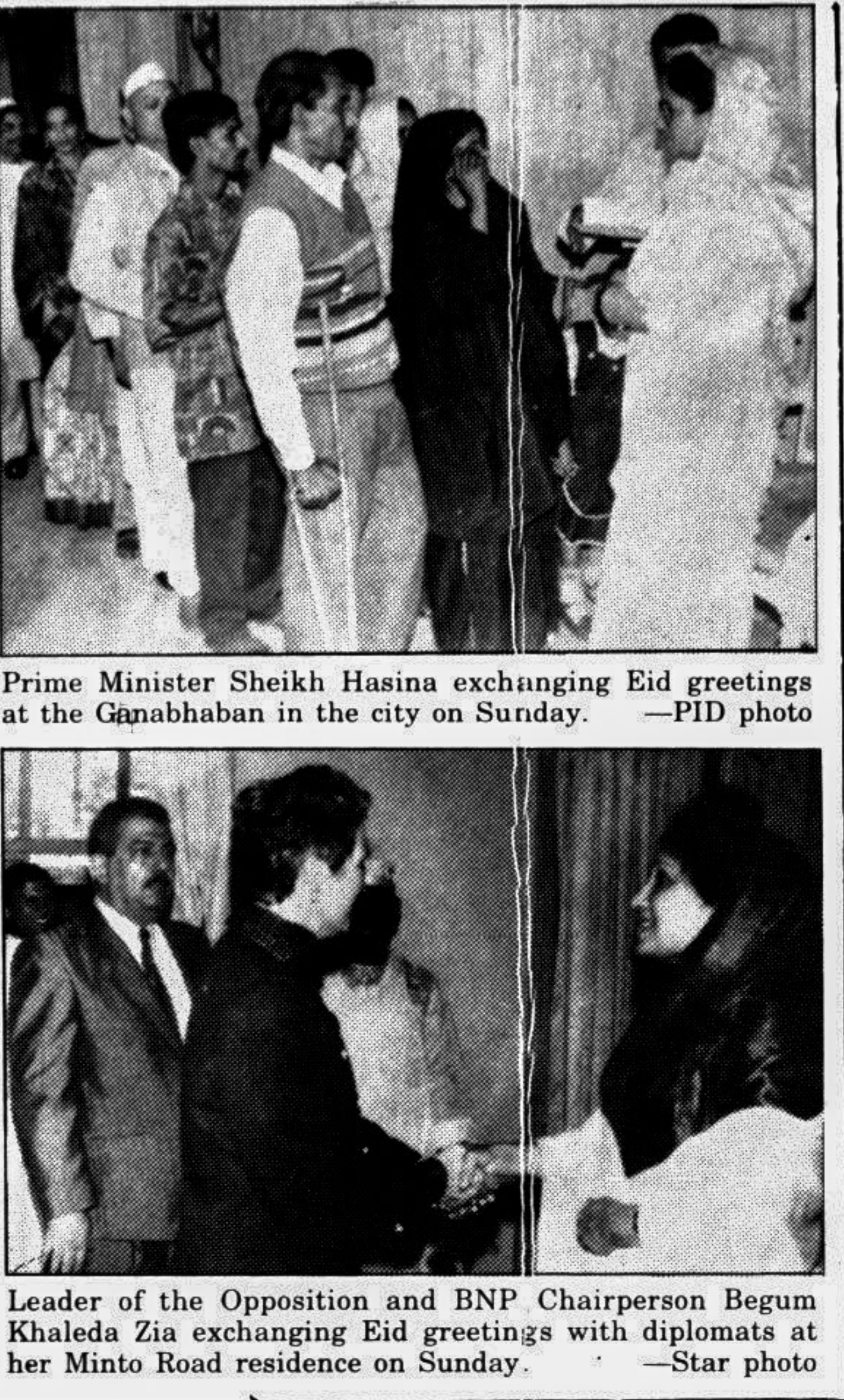
Prime Minister Sheikh Hasina exchanging Eid greetings with the Gnanabhaban in the city on Sunday.