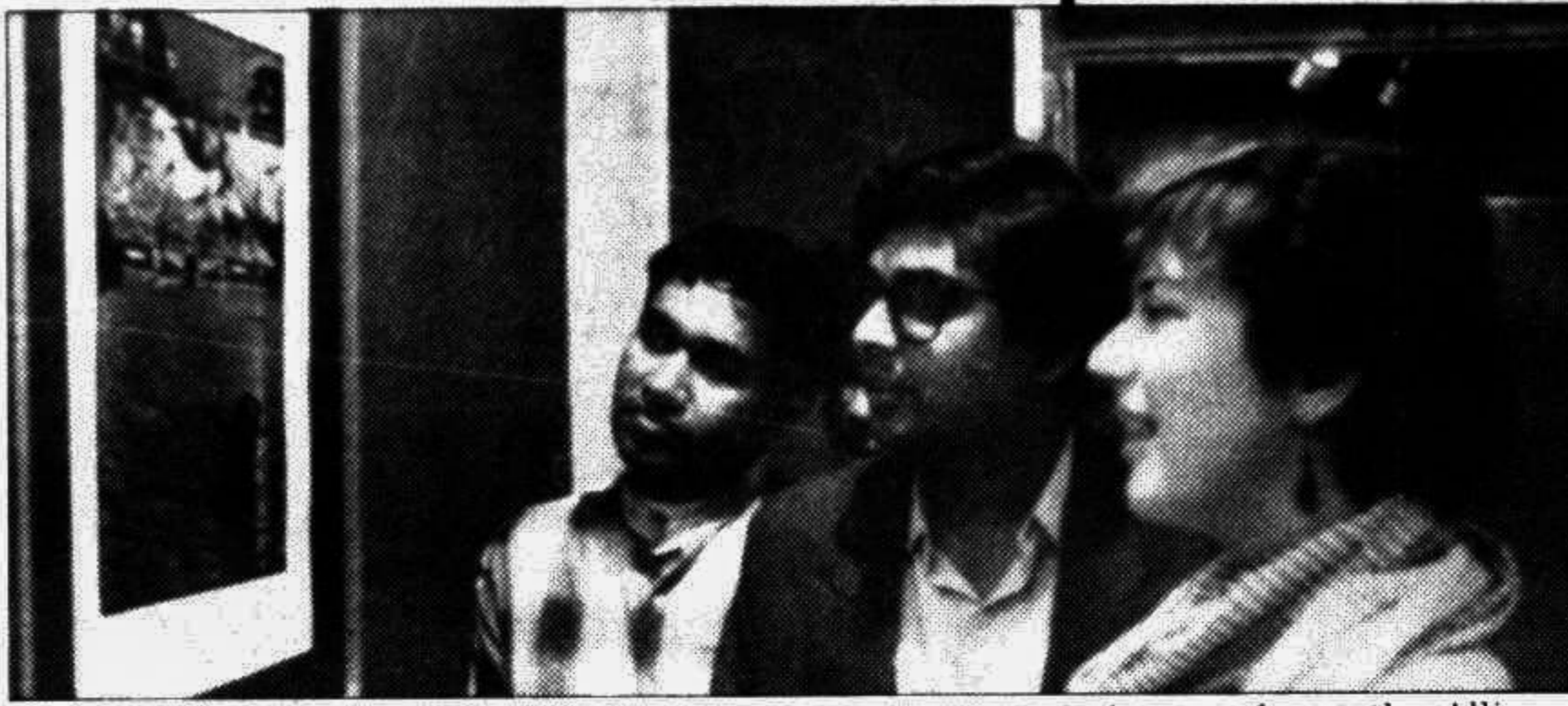
Visitors at the inaugural of Anwar Hossain's exhibition of photographs at the Alliance Francaise in the city yesterday.