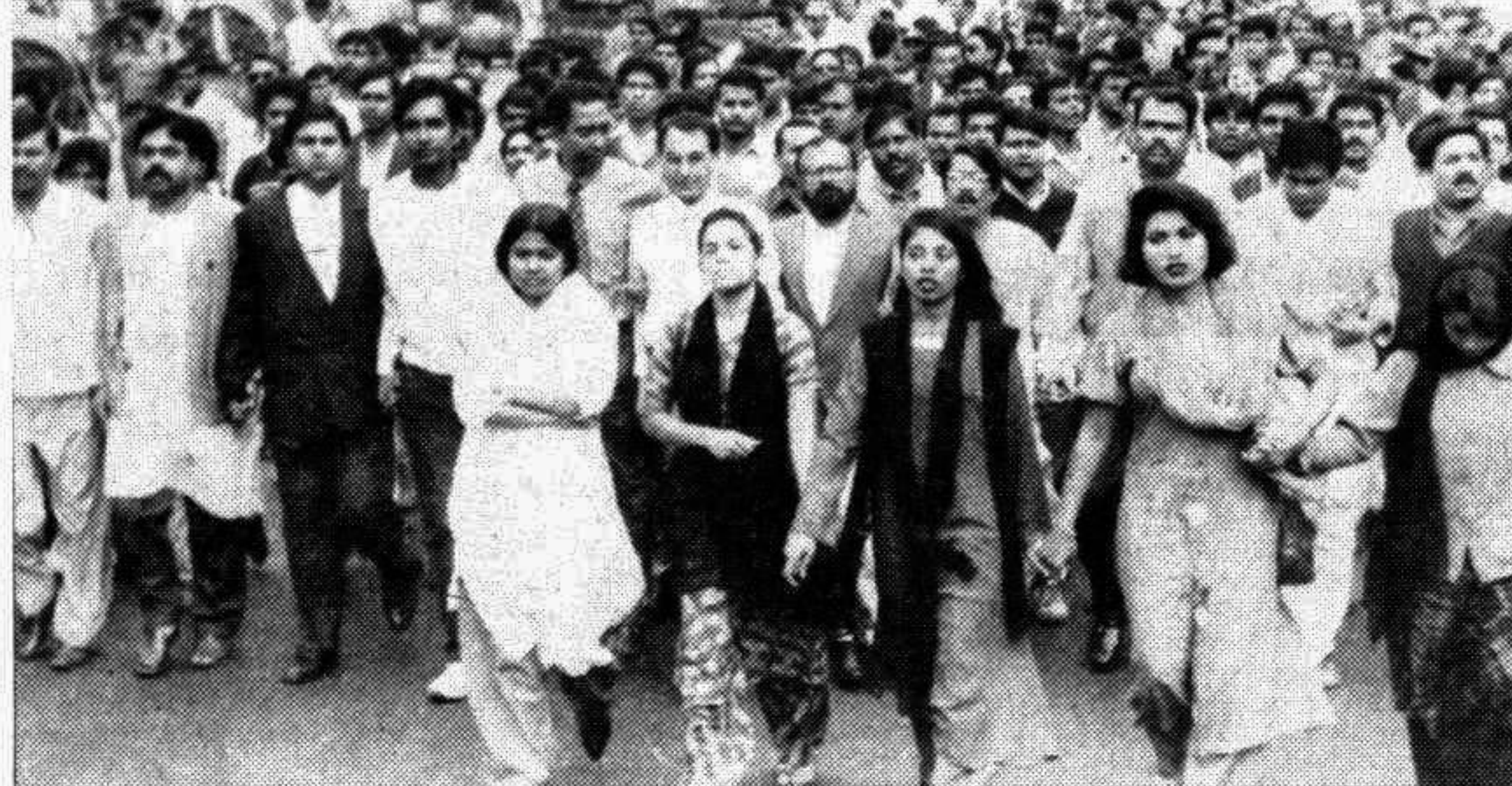
The pontoon bridge, linking the mazar of late president Ziaur Rahman on the 'Chandrima Uddayan' with the Crescent Lake Road, has been temporarily closed by the roads and highways department for urgent repair works. (Top) and BNP-city unit brought out a procession yesterday protesting the closure (bottom).