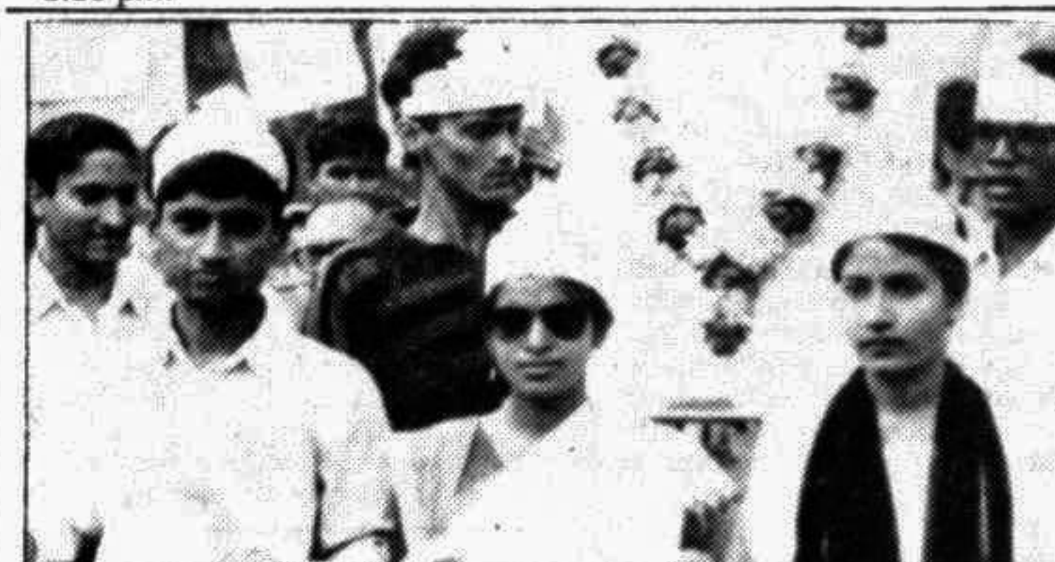
Bibeknanda Shikha O Sangskriti Parishad brought out a rally marking the 134th anniversary of Swami Bibeknanda in the city yesterday.

Rotary Club of Dhaka North: The regular weekly meeting of the club will be held. Venue: Sonargaon Hotel. Time: 5.30 pm.